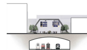
DETAL PRZESZCZĄT 1:1 000