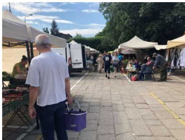
Fot 2 (na końcu alejki z widokiem na wejście)