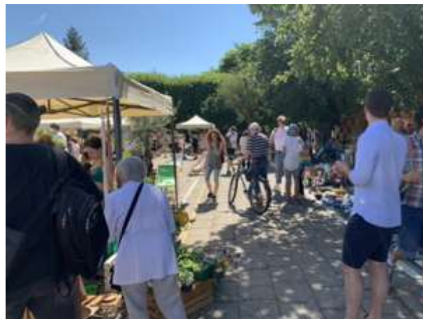
Fot 2 (na końcu alejki z widokiem na wejście)