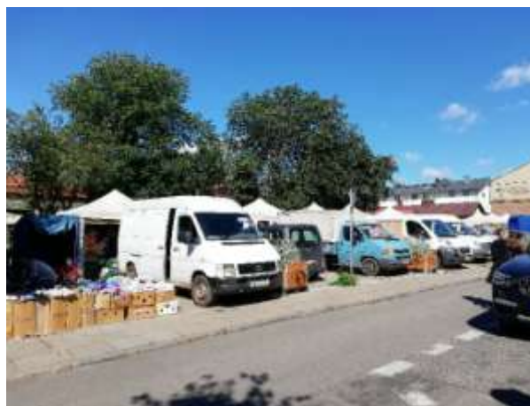
Fot 4 (z narożnika ul Schopenhauera + ob. Westerplatte, jak wizualizacja)