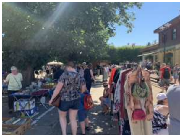
Fot 3 ( od strony przejazdu przy latarni pomiędzy budynkiem i drzewami widok w stronę ul. Obrońców Westerplatte)