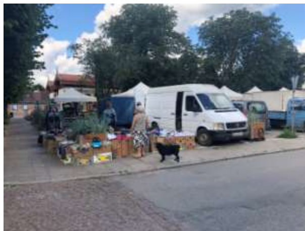
Fot 4 (z narożnika ul Schopenhauera + ob. Westerplatte, jak wizualizacja)