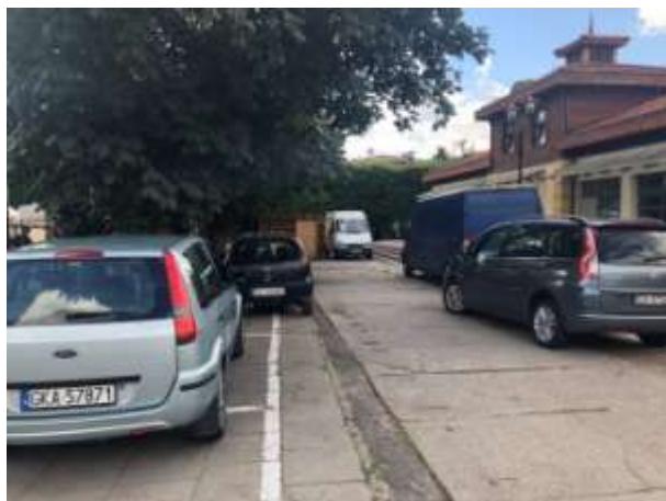
Fot 3 ( od strony przejazdu przy latarni pomiędzy budynkiem i drzewami widok w stronę ul. Obrońców Westerplatte)