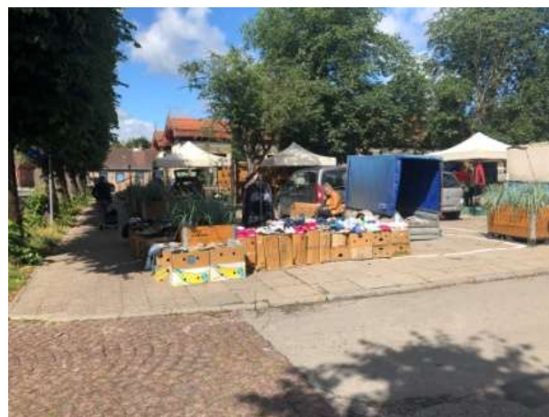
Fot 4 (z narożnika ul Schopenhauera + ob. Westerplatte, jak wizualizacja)