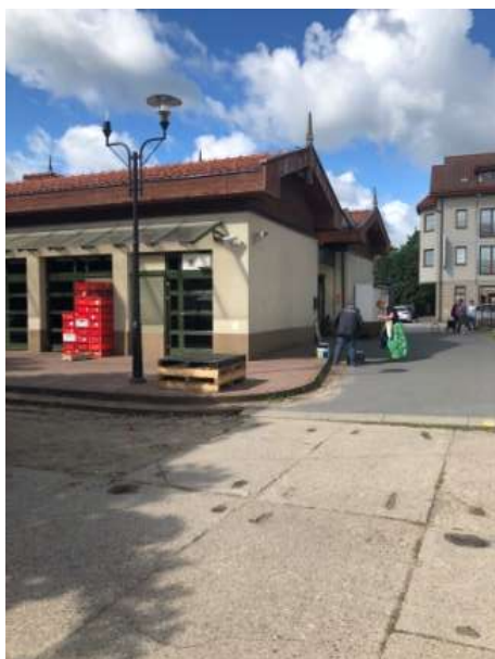
Fot 3 ( od strony przejazdu przy latarni pomiędzy budynkiem i drzewami widok w stronę ul. Obrońców Westerplatte)