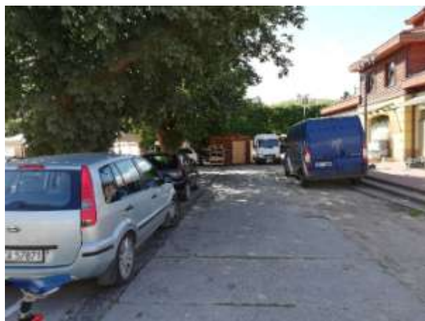
Fot 3 ( od strony przejazdu przy latarni pomiędzy budynkiem i drzewami widok w stronę ul. Obrońców Westerplatte)