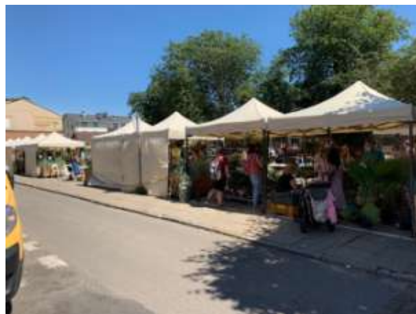
Fot 4 (z narożnika ul Schopenhauera + ob. Westerplatte, jak wizualizacja)