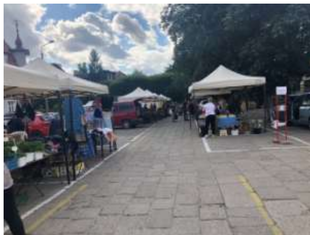
Fot 2 (na końcu alejki z widokiem na wejście)