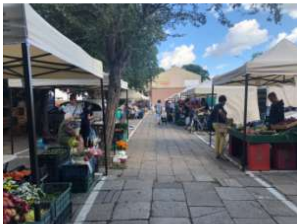
Fot 1 (wejście z widokiem na główną alejkę)