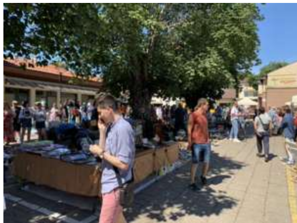
Fot 1 (wejście z widokiem na główną alejkę)