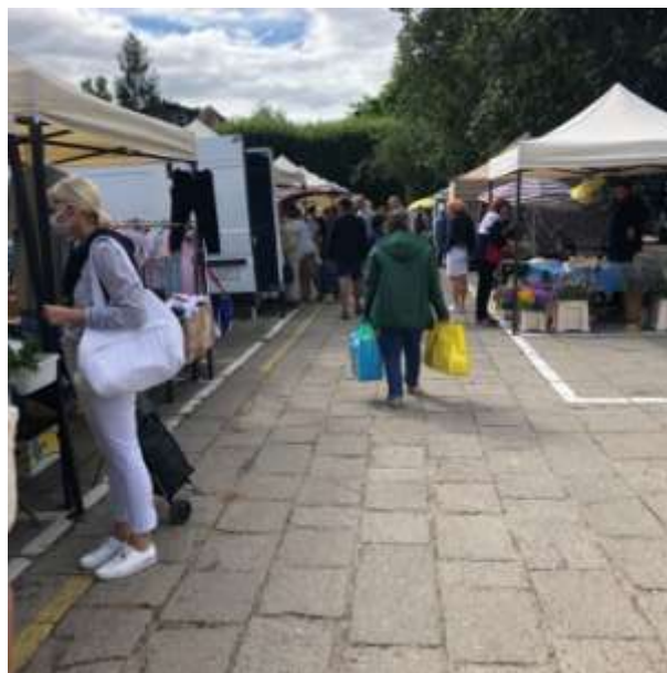
Fot 2 (na końcu alejki z widokiem na wejście)