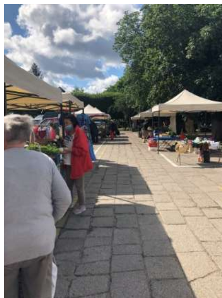
Fot 2 (na końcu alejki z widokiem na wejście)