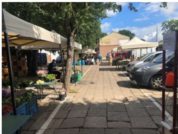
Fot 1 (wejście z widokiem na główną alejkę)