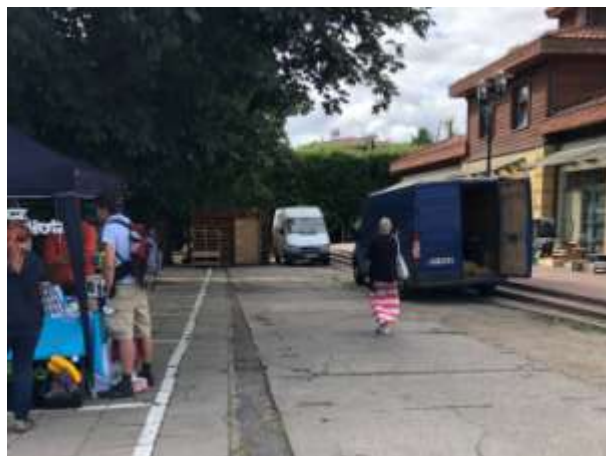
Fot 3 ( od strony przejazdu przy latarni pomiędzy budynkiem i drzewami widok w stronę ul. Obrońców Westerplatte)