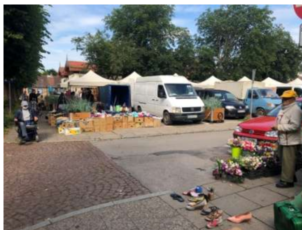
Fot 4 (z narożnika ul Schopenhauera + ob. Westerplatte, jak wizualizacja)