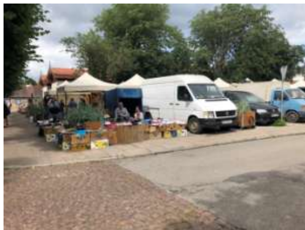
Fot 4 (z narożnika ul Schopenhauera + ob. Westerplatte, jak wizualizacja)