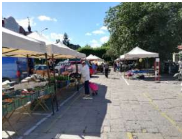
Fot 2 (na końcu alejki z widokiem na wejście)