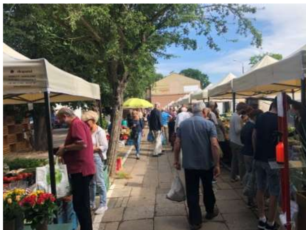
Fot 1 (wejście z widokiem na główną alejkę)