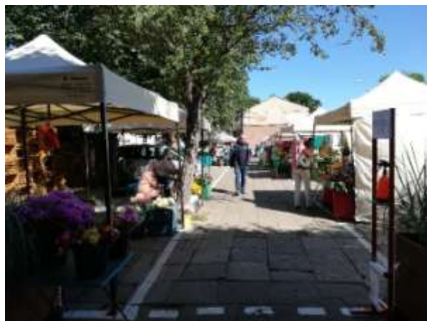
Fot 1 (wejście z widokiem na główną alejkę)