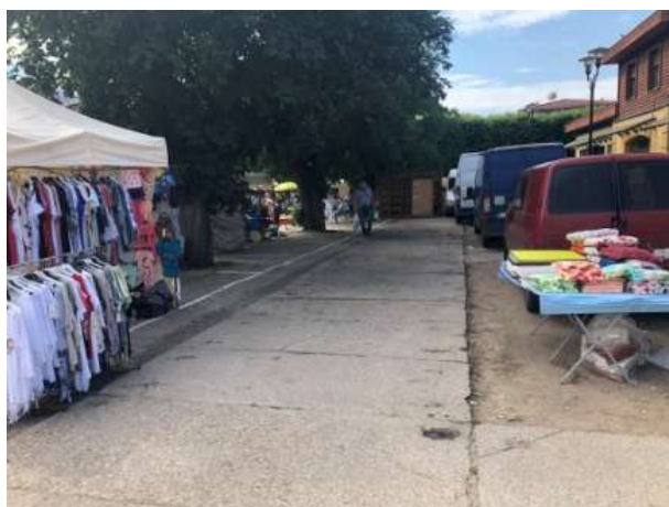
Fot 3 ( od strony przejazdu przy latarni pomiędzy budynkiem i drzewami widok w stronę ul. Obrońców Westerplatte)