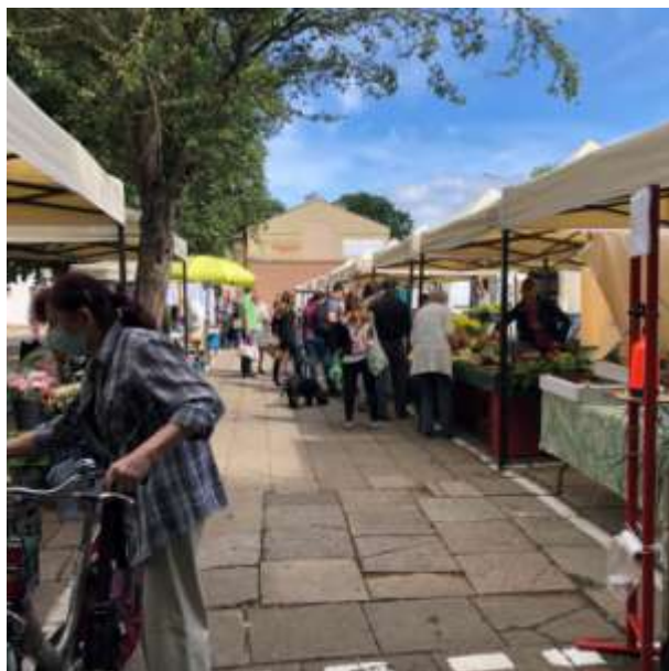
Fot 1 (wejście z widokiem na główną alejkę)