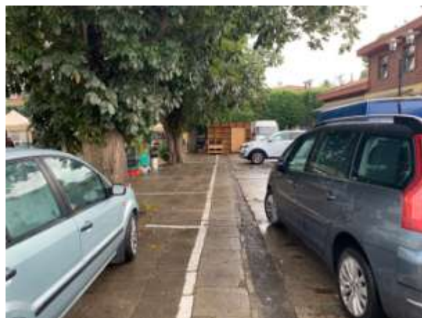
Fot 3 ( od strony przejazdu przy latarni pomiędzy budynkiem i drzewami widok w stronę ul. Obrońców Westerplatte)