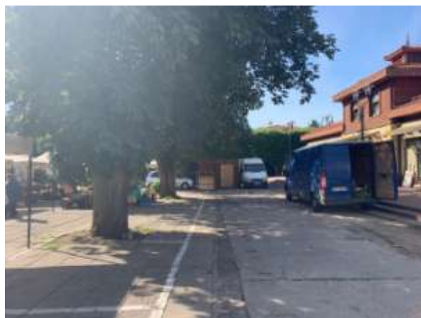
Fot 3 ( od strony przejazdu przy latarni pomiędzy budynkiem i drzewami widok w stronę ul. Obrońców Westerplatte)