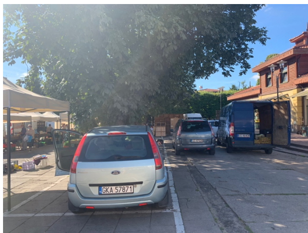
Fot 3 ( od strony przejazdu przy latarni pomiędzy budynkiem i drzewami widok w stronę ul. Obrońców Westerplatte)