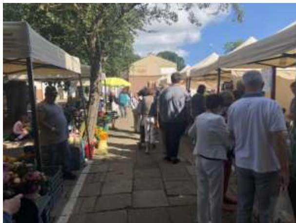
Fot 1 (wejście z widokiem na główną alejkę)