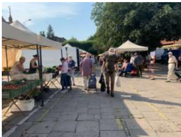
Fot 2 (na końcu alejki z widokiem na wejście)