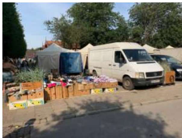
Fot 4 (z narożnika ul Schopenhauera + ob. Westerplatte, jak wizualizacja)