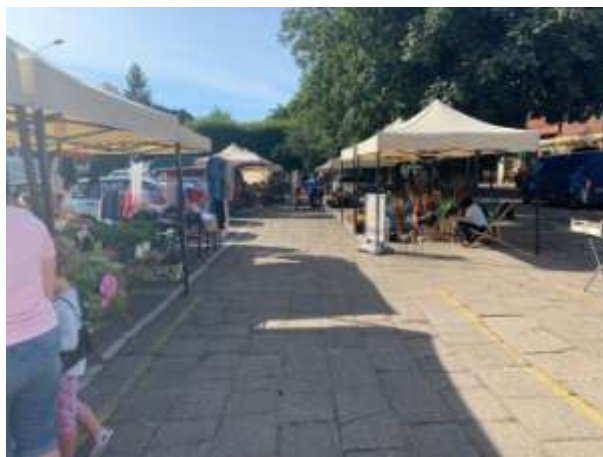
Fot 2 (na końcu alejki z widokiem na wejście)