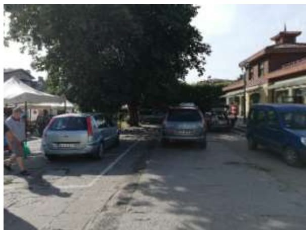
Fot 3 ( od strony przejazdu przy latarni pomiędzy budynkiem i drzewami widok w stronę ul. Obrońców Westerplatte)