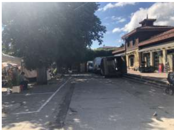
Fot 3 ( od strony przejazdu przy latarni pomiędzy budynkiem i drzewami widok w stronę ul. Obrońców Westerplatte)