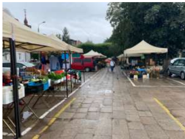
Fot 2 (na końcu alejki z widokiem na wejście)