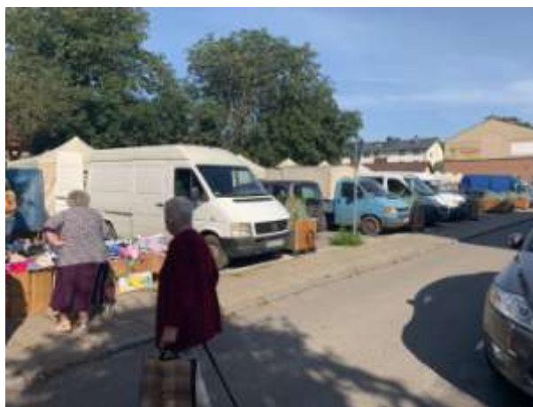
Fot 4 (z narożnika ul Schopenhauera + ob. Westerplatte, jak wizualizacja)