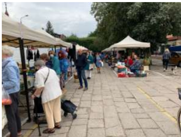
Fot 2 (na końcu alejki z widokiem na wejście)