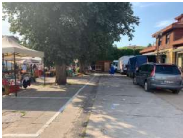
Fot 3 ( od strony przejazdu przy latarni pomiędzy budynkiem i drzewami widok w stronę ul. Obrońców Westerplatte)