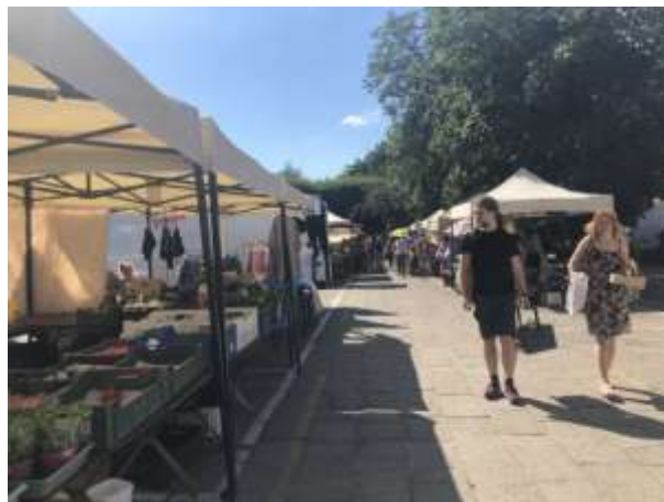
Fot 2 (na końcu alejki z widokiem na wejście)