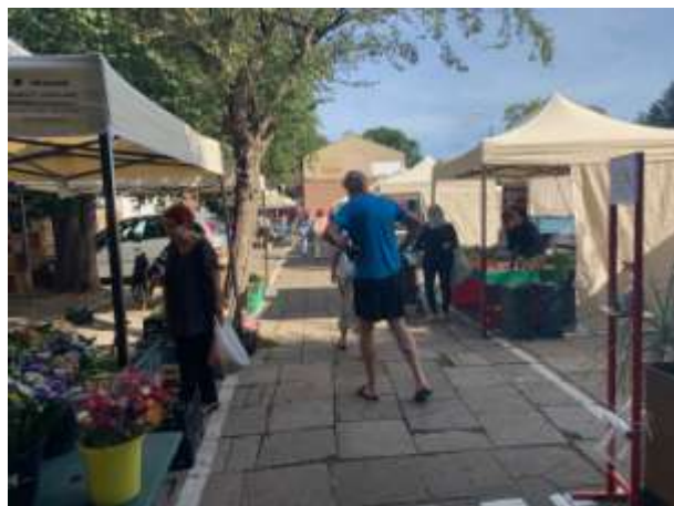
Fot 1 (wejście z widokiem na główną alejkę)