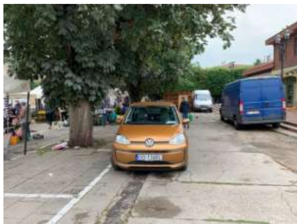
Fot 3 ( od strony przejazdu przy latarni pomiędzy budynkiem i drzewami widok w stronę ul. Obrońców Westerplatte)