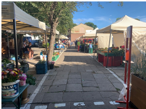
Fot 1 (wejście z widokiem na główną alejkę)