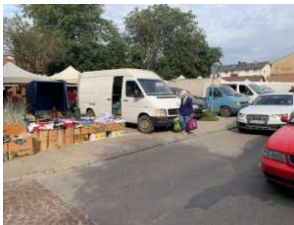
Fot 4 (z narożnika ul Schopenhauera + ob. Westerplatte, jak wizualizacja)