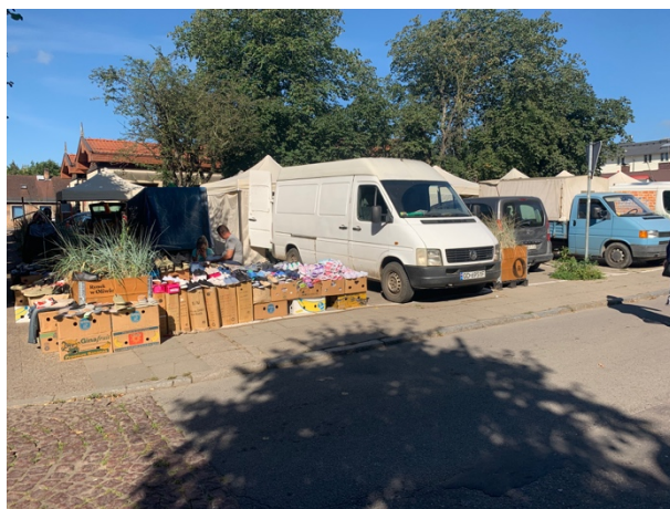
Fot 4 (z narożnika ul Schopenhauera + ob. Westerplatte, jak wizualizacja)