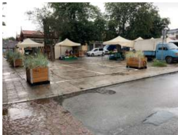
Fot 4 (z narożnika ul Schopenhauera + ob. Westerplatte, jak wizualizacja)