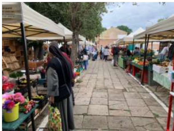
Fot 1 (wejście z widokiem na główną alejkę)