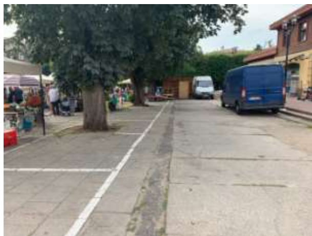
Fot 3 ( od strony przejazdu przy latarni pomiędzy budynkiem i drzewami widok w stronę ul. Obrońców Westerplatte)