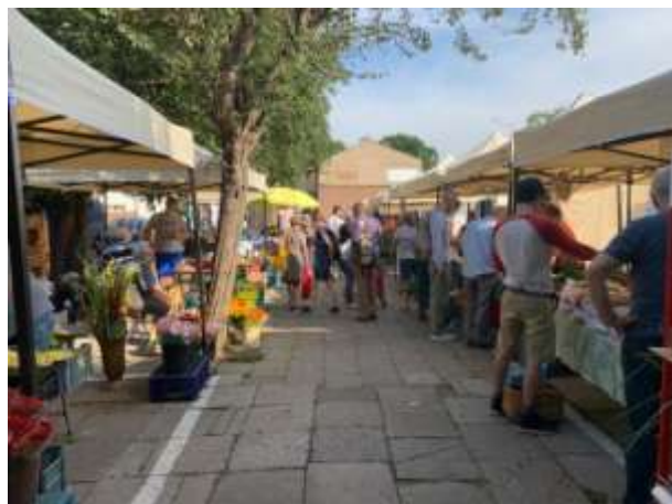
Fot 1 (wejście z widokiem na główną alejkę)