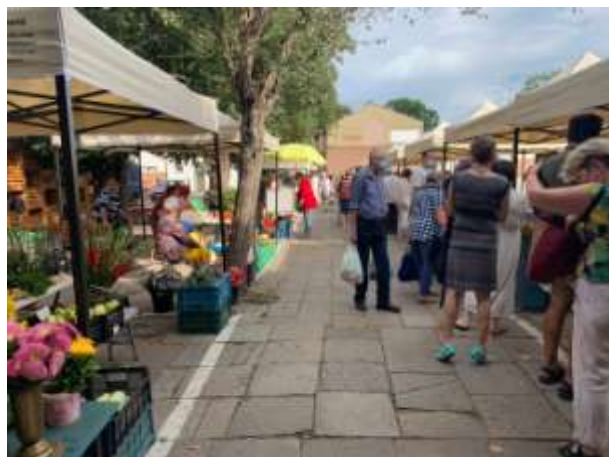
Fot 1 (wejście z widokiem na główną alejkę)