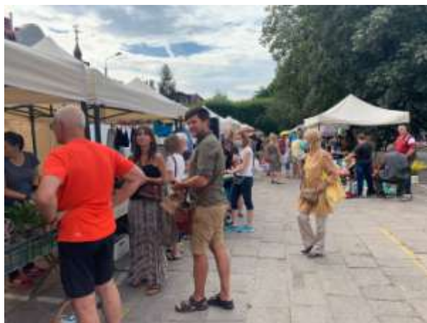
Fot 2 (na końcu alejki z widokiem na wejście)