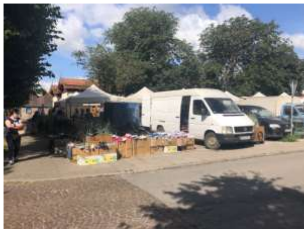
Fot 4 (z narożnika ul Schopenhauera + ob. Westerplatte, jak wizualizacja)