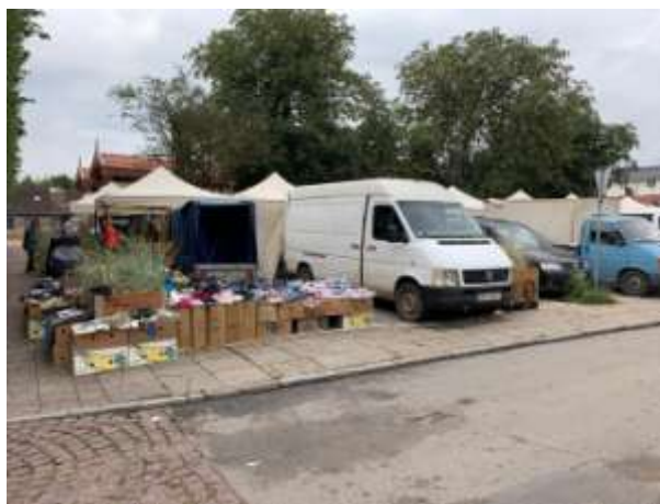
Fot 4 (z narożnika ul Schopenhauera + ob. Westerplatte, jak wizualizacja)