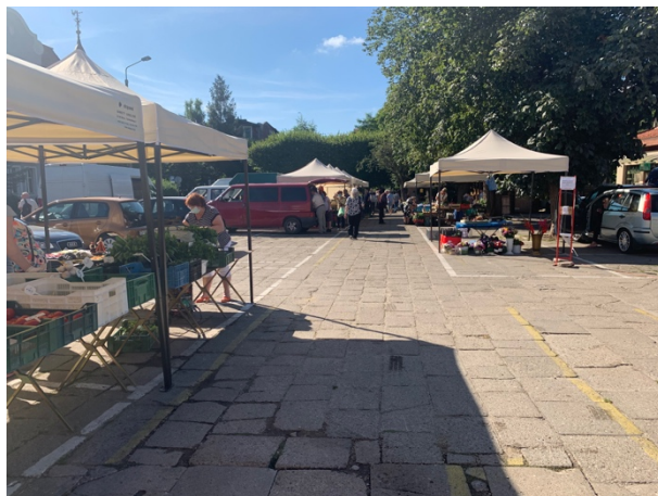
Fot 2 (na końcu alejki z widokiem na wejście)