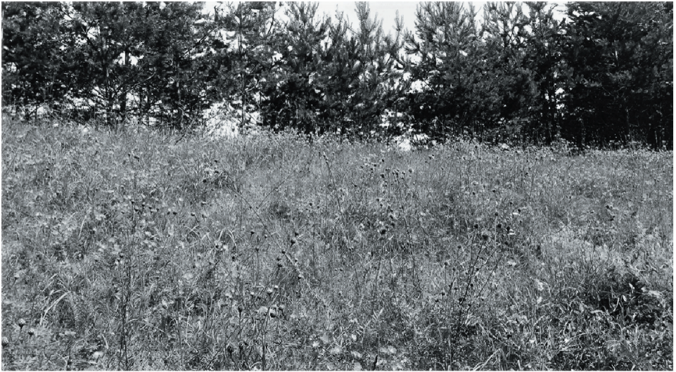
Ryc. 2. Murawa na zboczu ozu nieopodal rezerwatu Bachanowo w Suwalskim Parku Krajobrazowym. 2017 r.