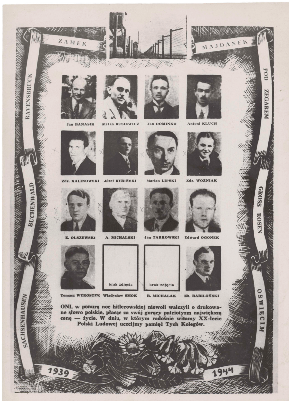
Il. 4. Tableau upamiętniające śmierć szesnastu lubelskich drukarzy w okresie II wojny światowej.