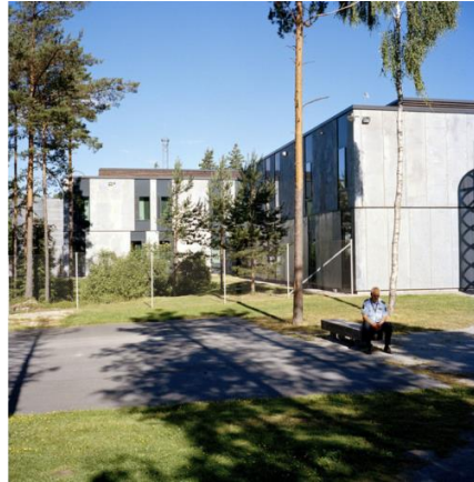
Fig. 3. Halden Prison: a view from the outside. Source: [11] Ryc.3. Halden Prison: widok zewnętrzny. Źródło: [12]