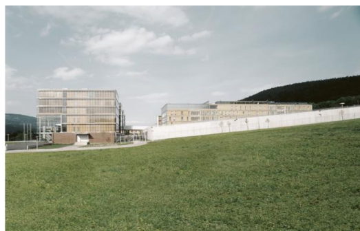
Fig. 7. Leoben Centre of Justice: on the left: a view of the Court – Part ; on the right: a view of the Prison - Part. Source: [13]

Ryc.7. Leoben Centre of Justice: po lewej: widok na część zajmowaną przez sąd; po prawej: widok na część zajmowaną przez więzienie. Źródło: [13]