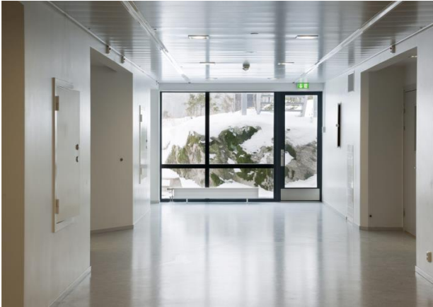
Fig. 2. Halden Prison: a view from the inside. Ryc.2. Halden Prison: widok wnętrza.