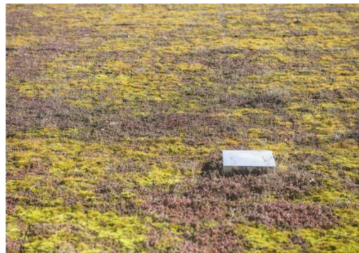
Fig. 6. Sollentuna Remand Prison: a green roof which helps to protect bee population. Source: [15]

Ryc. 5. Sollentuna Remand Prison: wnętrze budynku Tabellen 4. Źródło: [15]