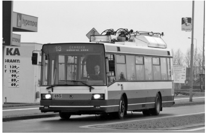
Fot. 1. Škoda 21TrACI w Pilźnie w trakcie przejazdu przy zasilaniu z agregatu spalinowego

Baterie trakcyjne dostępne są w różnych technologiach i zazwyczaj dedykowane każdemu przedsiębiorstwu indywidualnie. W regularnej eksploatacji pozostają w Europie akumulatory ołowiowe, niklowo-wodorkowe, niklowo-kadmowe (fot. 5), a w ostatnich miesiącach rozważa się wprowadzenie do eksploatacji bardzo lekkich litowo-jonowych. Określając zalety baterii, należy jednoznacznie wyznaczyć ich nieemisyjność w odróżnieniu od agregatów spalinowych. Trolejbus korzystający z zasilania bateryjnego pozostaje nadal pojazdem w stu procentach elektrycznym, co jest szczególnie ważne dla przedsiębiorstw eksploatujących łącznie pojazdy korzystające z energii elektrycznej. W przypadku agregatów spalinowych jest uciążliwe w zajęciach niedostosowanych do obsługi pojazdów spalinowych. W przypadku akumulatorów ten aspekt nie występuje, ale i bardziej odczuwalną ich wadą jest ograniczony zasięg.