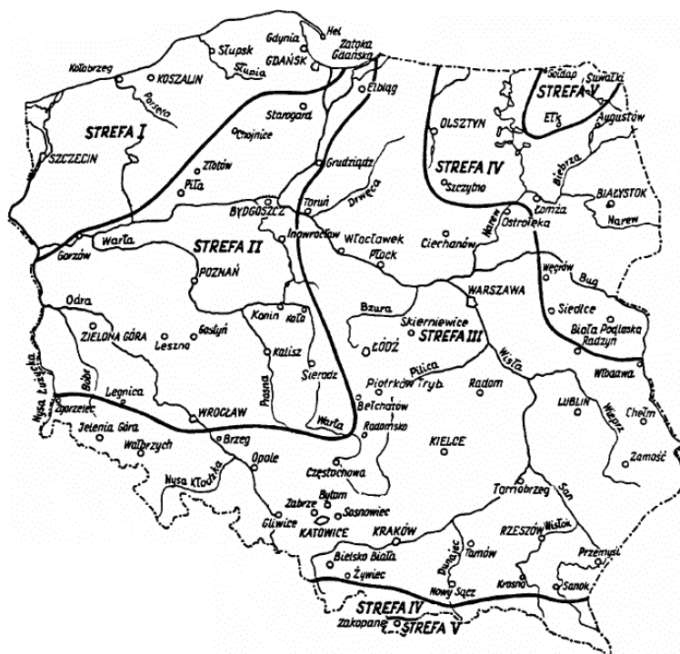
Rysunek 1. Mapa klimatyczna Polski ze wskazaniem na poszczególne strefy Figure 1. Climatic map of Poland with indication of particular zones

Źródło: opracowanie własne według PN-EN 12831:2006