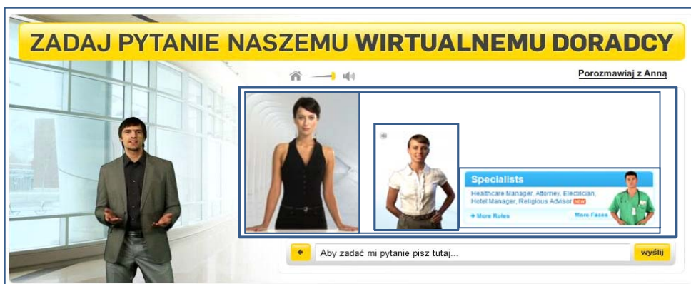
Rys. 3. Wirtualni agenci – przykłady

To, czy odpowiedzi agenta zgodne są z oczekiwaniami użytkownika (co do ich formy oraz zawartości merytorycznej), zależy zarówno od treści, jak i sposobu generowania wypowiedzi. Ponadto wygląd i zachowanie agenta tworzą znaczną część UX użytkownika, a cechy i zachowania agenta niewłaściwie dobrane do specyfiki firmy/serwisu nie tylko mogą obniżyć zaufanie użytkownika do wypowiedzi samego agenta, ale także przełożyć się negatywnie na wiarygodność serwisu/firmy oraz jej wizerunek. Z badań UX oczekiwanego wyniku w oczywisty sposób, że użytkownicy oczekują innego typu osobowości i zachowań np. od agenta kancelarii prawniczej, od agenta usług medycznych czy od wirtualnego doradcy z zakresu prac instalatorsko-budowlanych (rys. 3).