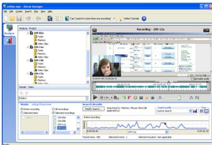
Rys. 1. Fragment badania User Experience opartego na testach użyteczności, prowadzonego z wykorzystaniem oprogramowania analitycznego Techsmith Morae