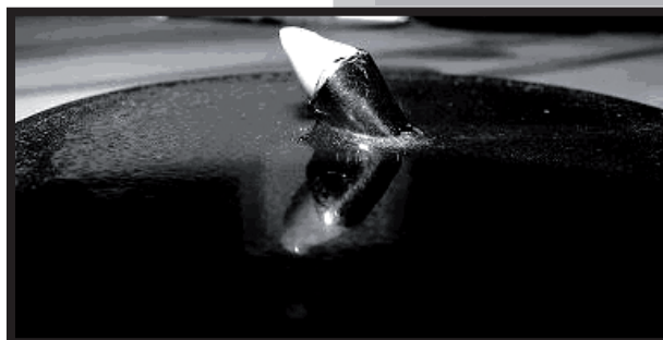
RYS.4. Koronka osadzona na trzpieniu przed próbą ściskania. FIG.4. The crown set on an arbour before the compression test.

Weryfikację doświadczającą otrzymanych wyników metodą MES przeprowadzono na specjalnym do tego celu przygotowanym stanowisku wytrzymałościowym do prób ściskania i wolnozmiennego zmęczenia. Koronkę stomatologiczną zamocowano na specjalnym trzpieniu tak, by kąt działania siły do osi głównej wyniósł 45^\circ (rys. 4). W próbie ściskania koronka uległa zniszczeniu przy sile 350N, a wolnozmiennemu zmęczeniu w