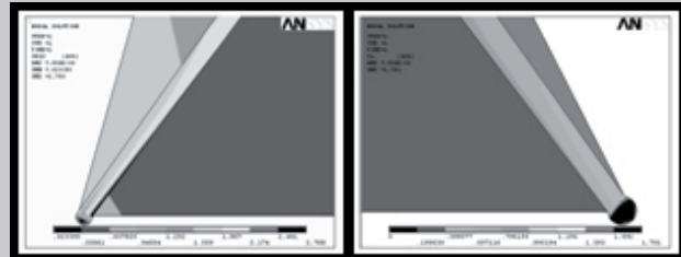
RYS.2. Naprężenia zredukowane w lewej przyszyjkowej stronie korony oraz rozciągające w prawej przyszyjkowej stronie korony. FIG.2. Stresses reduced in the left cervix side of the crown and tensile stresses in the right side of the crown.

In the left cervix section of the crown model there is the highest cutting stress, which may result in the unsticking in the adhesive connection between the dental crown cap and the dentine. In the right cervix section of the model there are the highest tensile stresses that are particularly hazardous for ceramics not resistant to this type of stress (FIG.2). Cutting stresses extend as far as the secant of a tooth. Ce-