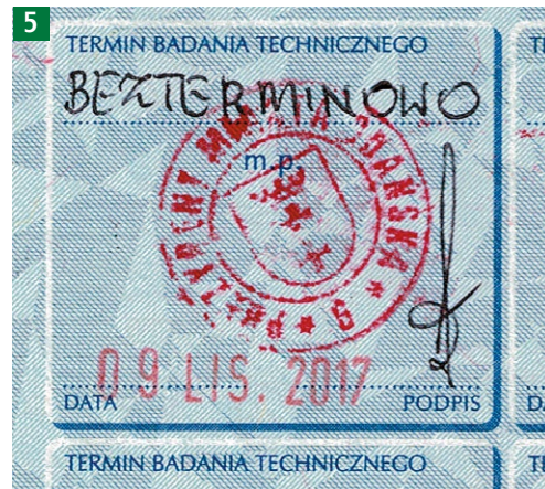
Dowód rejestracyjny z wpisem o bezterminowym badaniu technicznym

Zadaniem diagnosty jest podjęcie decyzji, które ograniczenia wprowadzi do ruchu drogowego dla danego pojazdu poprzez umieszczenie słowa TAK lub NIE przy danym ograniczeniu. Diagnosta ma również możliwość wprowadzenia przez siebie zaproponowanego dodatkowego rodzaju ograniczenia lub dodatkowych ograniczeń w pozycji INNE, które wcześniej w omawianym punkcie nie były wymienione.