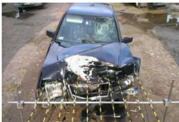
Rys. 2. Zakres uszkodzeń pojazdu badanego (widok od czoła)

Badany pojazd uległ zderzeniu czołowemu z innym pojazdem. Deformacji uległo czoło pojazdu, w tym: pokrywa silnika, pas przedni, podłużnice przednie, oraz błotniki przednie z obu stron. Na rysunkach 2 i 3 widoczny między innymi zakres uszkodzeń samochodu.