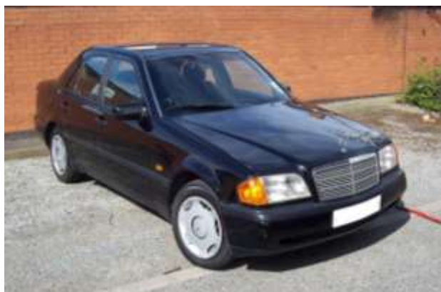
Rys. 1. Pojazd odpowiadający badanemu (przed kolizją) - Mercedes - Benz W202

Do przeprowadzenia pomiarów i obliczeń posłużył samochód osobowy marki Mercedes – Benz klasy C, model W202 z nadwoziem typu sedan (rys. 1). Wymiary pojazdu (długość x szerokość x wysokość): 4420 x 1678 x 1383 [mm], masa własna to 1150 [kg], rozstaw osi to: 2665 [mm].