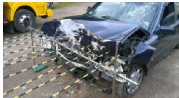
Rys. 3. Uszkodzenia pojazdu (lewa strona nadwozia)

Dane zebrane w tabeli 1 można przedstawić, jako profil odkształcenia czoła pojazdu (rys. 4).