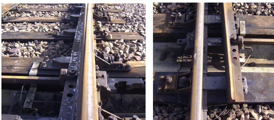
Rys.5. Widok na iglicę prawą prostą (z lewej) i iglicę lewą łukową(z prawej)

Badania rozjazdów kolejowych powinny obejmować [10]: