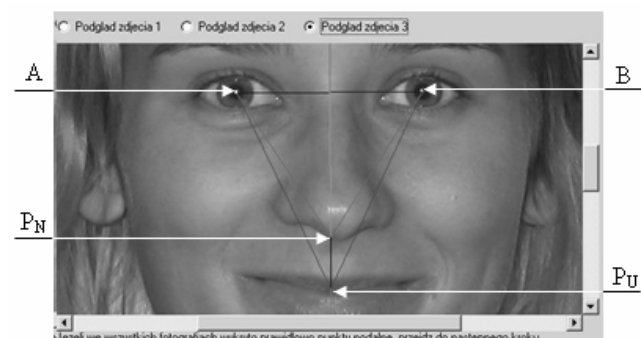
Rys. 1. Efekt końcowy zastosowania algorytmu detekcji i rozpoznawania twarzy Fig. 1. Final face detection and recognition effect

Graficzne przedstawienie pracy algorytmu zostało pokazane na rys. 1.