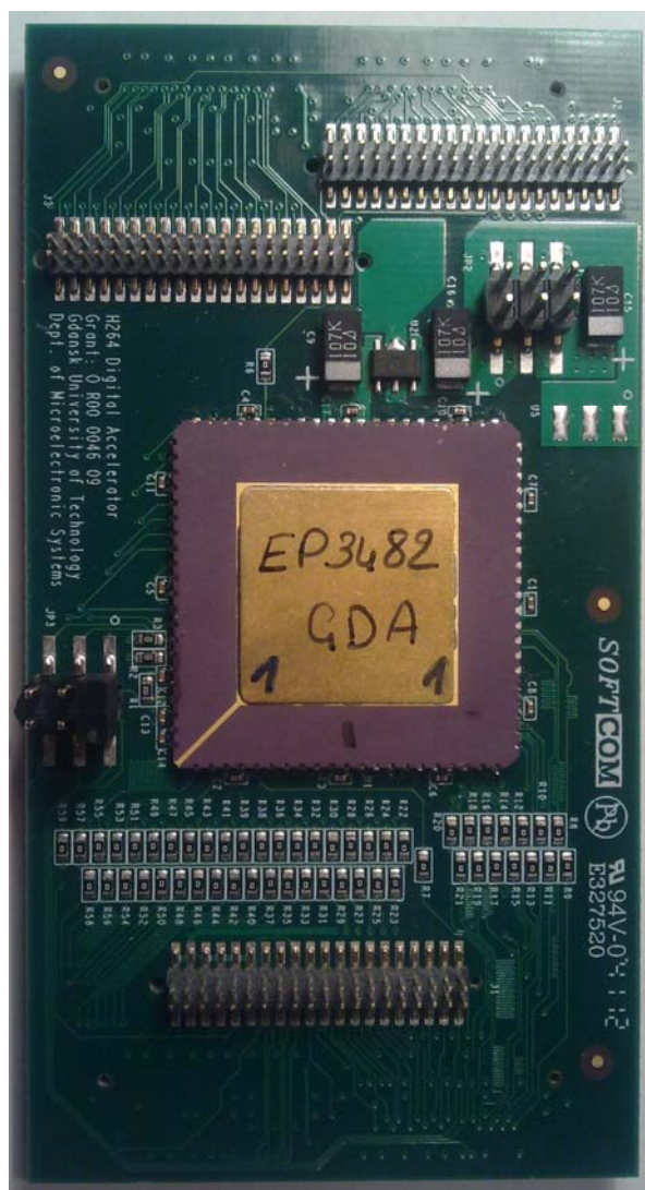
Rys.2. Fotografia płytki prototypowej z zamontowanym układem ASIC akceleratora estymacji ruchu

Na rysunku 2 przedstawiono zdjęcie płytki prototypowej z zamontowanym układem ASIC akceleratora.