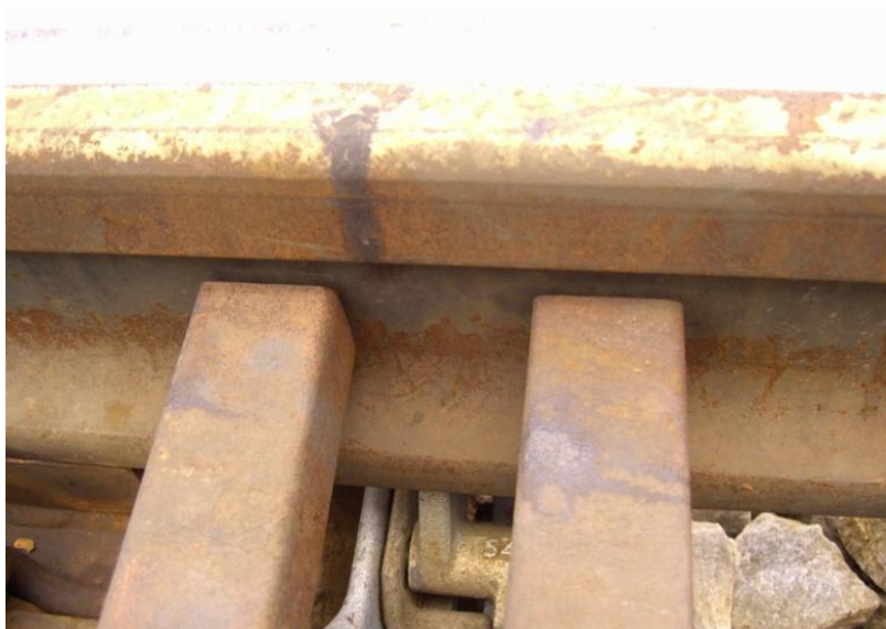
Fot.7. Brak przyleganie iglicy do opórek