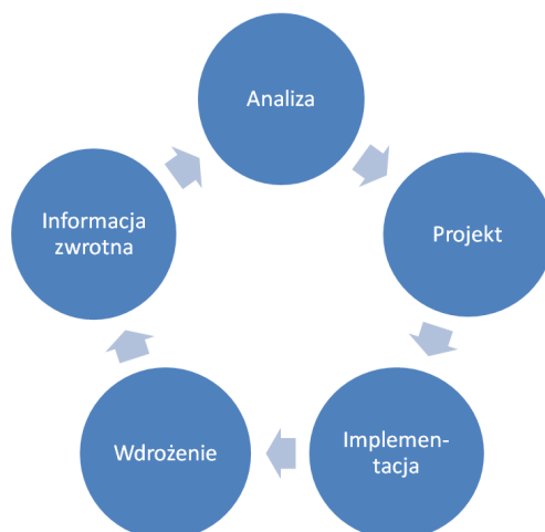
Rys. 1. Kluczowe etapy w zwinnych procesach wytwarzania oprogramowania

Pozwala, a wręcz nawet zachęca, do wprowadzania częstych zmian i udoskonaleń w tworzonej projekcie. Częsty kontakt z użytkownikiem i jego widoczny wpływ na kształt systemu pozwala zbudować zaufanie między zespołem wytwarzającym i odbiorcami. Wszystkie te cechy sprawiają, że realizacja projektów IT zgodnie z powyższą metodyką nie jest już nowością, lecz staje się normą. Według badań, aż dwie trzecie zespołów IT decyduje się na zwinne metodyki wytwarzania oprogramowania [5]. Jako główne zalety agile wskazywano większe zadowolenie końcowego odbiorcy z dostarczonego produktu, krótszy czas potrzebny do pierwszego uruchomienia produkcyjnego oraz niższe koszty wytworzenia.