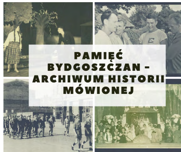
Paulina Gawrych, CC BY 4.0