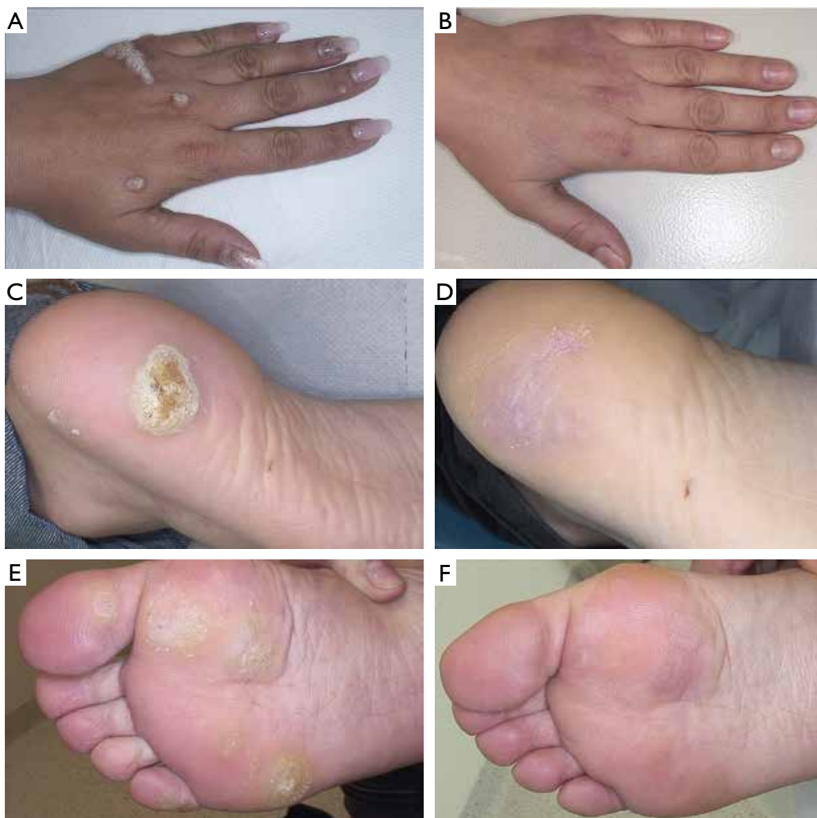
Figure 1. Clinical effects of treatment with intralesionally administered bleomycin in selected 3 patients with treatment-refractory viral warts in different anatomical locations. A – A 30-year-old female with resistant viral warts on the left hand previously treated unsuccessfully for 36 months in another clinic with cryotherapy (20 cycles) and different topical formulations (salicylic acid, 5-fluorouracil + salicylic acid, monochloroacetic acid); B – complete resolution of all lesions ( n = 13 ; not all visible in the figure) was observed after 10 courses of bleomycin treatment; C – a 19-year-old male with a resistant viral wart on the left heel previously treated unsuccessfully for 18 months in another clinic with cryotherapy (10 cycles) and salicylic acid; D – complete resolution of the lesion was observed after 7 courses of bleomycin treatment; E – a 32-year-old female with resistant viral warts on the anterior part of the right foot previously treated unsuccessfully for 12 months in another clinic with cryotherapy (10 cycles) and salicylic acid; F – complete resolution of all lesions was observed after 3 courses of bleomycin treatment

obserwowano żadnych ciężkich zdarzeń niepożądanych, które wymagałyby przerwania leczenia. Nie stwierdzono także objawów ogólnoustrojowych