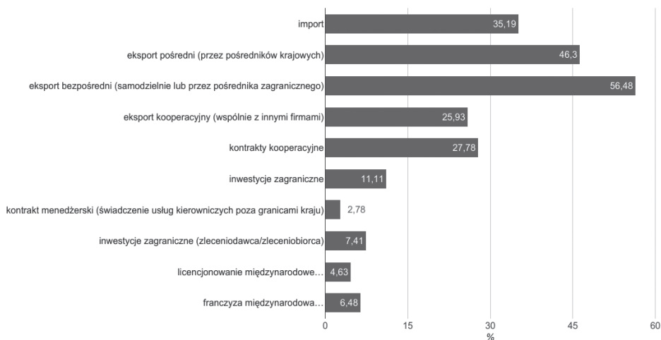
Rys. 3. Sposoby / formy umiędzynarodowienia