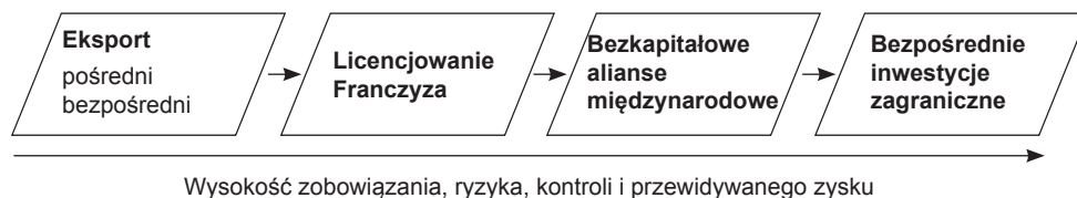
Rys. 1. Podstawowe cechy sposobów wejścia na rynki międzynarodowe

łączenie wiedzy partnerów (Pakulska T., Poniatowska-Jaksch M., 2015, s. 120–122). Umożliwia rozłożenie między nimi ryzyka i zapewnia dobry wizerunek spółki na rynku miejscowym. Wysokie koszty wejścia połączone są z wysokim ryzykiem działalności oraz ewentualnym konfliktem interesów eksportera i partnera. Ostatnią formą inwestycyjną jest spółka córka (spółka w pełni zależna), czyli w całości stanowiąca własność przedsiębiorstwa macierzystego. Zachowanie pełnej kontroli jest zapewnione przez kontrolę centralną. Zapewnia dobry wizerunek na rynku miejscowym i potencjalnie największą opłacalność finansową. Podobnie jak spółka joint venture posiada wysokie koszty wejścia oraz wysokie ryzyko działalności. Wszystkie formy inwestycyjne posiadają skomplikowaną procedurę rejestracyjną.