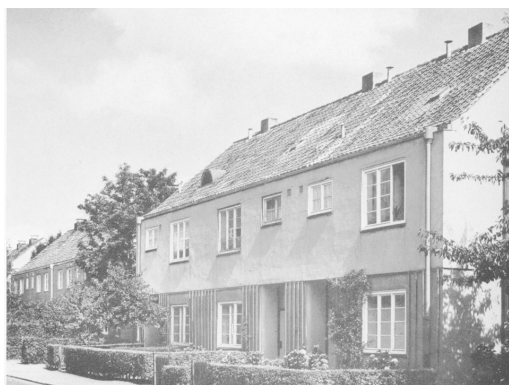
Fot. 4. Rozbudowa osiedla Steenkamp przez G. Oelsnera, 1925/26.