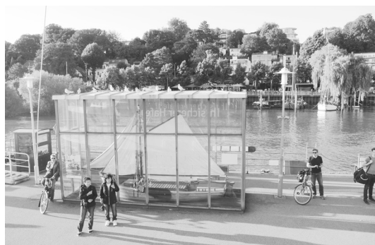
Fot. 1. Altona – bulwary nad Łabą będące elementem systemu zieleni miejskiej stworzonego przez Gustava Oelsnera we współpracy z Maxem Brauerem. Stan obecny Źródło: [B. Macikowski].

wanego centrum do nowych osiedli budowanych na zachodnich obrzeżach miasta, pełnych świeżego powietrza i słońca. W ten sposób, dzięki przeważającym zachodnim wiałom, mieszkańcy mieli być pozbawieni szkodliwego wpływu smogu i dymów znad przemysłowej i portowej strefy Altony, jak również i znad samego Hamburga, położonych na wschód od Altony. Oelsner wspierał budownictwo komunalne i opracował nowy program architektoniczny dla budownictwa socjalnego i terenów zieleni miejskiej. Wraz z Maxem Brauerem, nadburmistrzem Altony, udało się zrealizować system zielonych korytarzy dla miasta i stworzyć siedem parków publicznych na terenach zakupionych na ten cel przez władze miejskie. Stworzony wówczas system zieleni miejskiej do dziś formuje zasadniczy rdzeń zielonych przestrzeni publicznych miasta, budując jego przyjazny mieszkańcom charakter [Kostrzewska 2016]. W okresie Wielkiego Kryzysu, po 1923 r., mimo trudności ekonomicznych, Oelsnerowi udało się stworzyć pierwszą spółdzielnię mieszkaniową SAGA, która do dzisiaj administruje 130 tys. mieszkań w Hamburgu [Michelis 2008] (fot. 1).