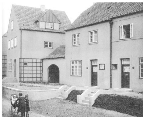
Fot. 3. Zabudowa mieszkaniowa w Gartenstadt Steenkamp, 1920

Pozostałe osiedla modernistyczne w Gdańsku nie tworzą już tak zwartych i rozległych zespołów urbanistycznych. Poza Wrzeszczem jedynie w Siedlcach powstała nowa dzielnica mieszkaniowa o zróżnicowanej intensywności i formie zabudowy. Inne osiedla realizowano przeważnie w formie niewielkich zespołów zabudowy jednorodzinnej o skali od jednej do kilku ulic. Była to najczęściej zabudowa o tradycyjnych cechach architektury, jednorodząwa wzdłuż ulic, z kalenicami prostopadle lub równoległe do osi jezdni, choć pojawia się też forma zabudowy kwartałowej, w formie obrzeżnie zabudowanego czworoboku, co może przywoływać idee wiedeńskich