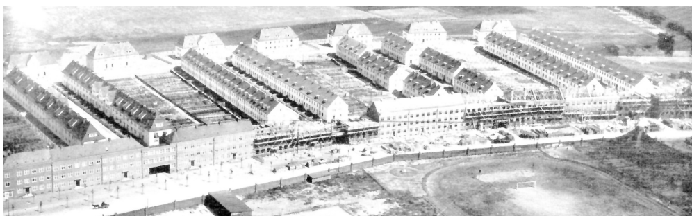
Fot. 2. Gdańsk-Wrzeszcz, północna pierzeja Ringstrasse w trakcie budowy, arch. Martin Kießling i Albert Krüger. Widoczna zwarta zabudowa podkreślająca przebieg ulicy i szeregową zabudowę linijkową wewnątrz bloku urbanistycznego

i urbanistykę niemiecką, choć z zauważalną już dbałością o rozwiązania funkcjonalne postulowane przez modernistów, zapewniające odpowiednie warunki nasłonecznienia i przewietrzania, orientację względem stron świata, odległości w zabudowie, dostęp do zieleni, a także umiarkowane wskaźniki intensywności zabudowy.