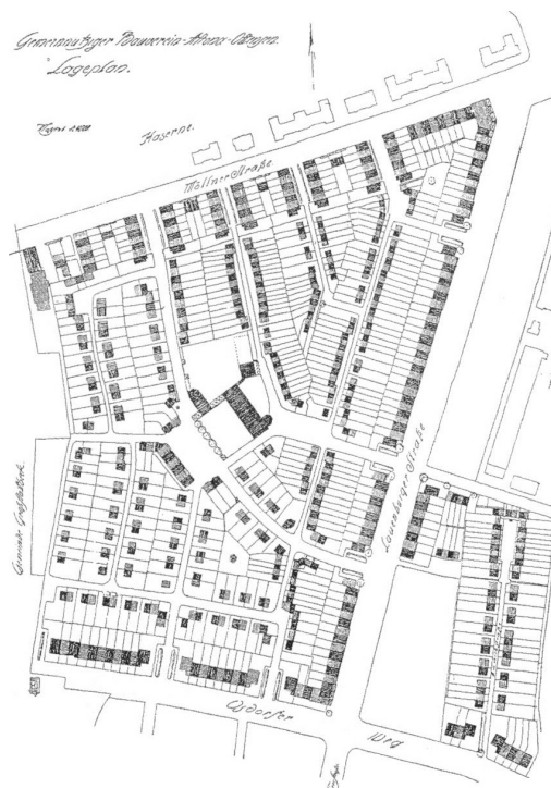
Ryc. 3. Plan rozbudowy miasta-ogrodu Steenkamp w Altonie, 1915, arch. F. Neugebauer

pozycji, osiowość, dbałość o kształtowanie wnętrza urbanistycznych, strome dachy kryte dachówką, zabudowa o skali i charakterze bardziej wiejskim niż miejskim – te cechy kompozycji urbanistycznej były raczej negowane przez modernistów awangardowych lub tych reprezentujących styl międzynarodowy, niemniej znakomicie wpisywały się w ideę howardiańską. W planie zabudowy widać dążenie do liniowego kształtowania zabudowy w układzie północno-południowym. Każdy z domów był dwukondygnacyjny, o skromnej, ale wystarczającej dla jednej rodziny powierzchni 70 m 2 . Wszystkie ogródki frontowe miały być obsadzone roślinnością w ten sam sposób, aby manifestować motto tego miasta-ogrodu, które brzmiało: „prostota, równość, przejrzystość i wspólnota” [Michelis 2008] (fot. 2, 3, 4).