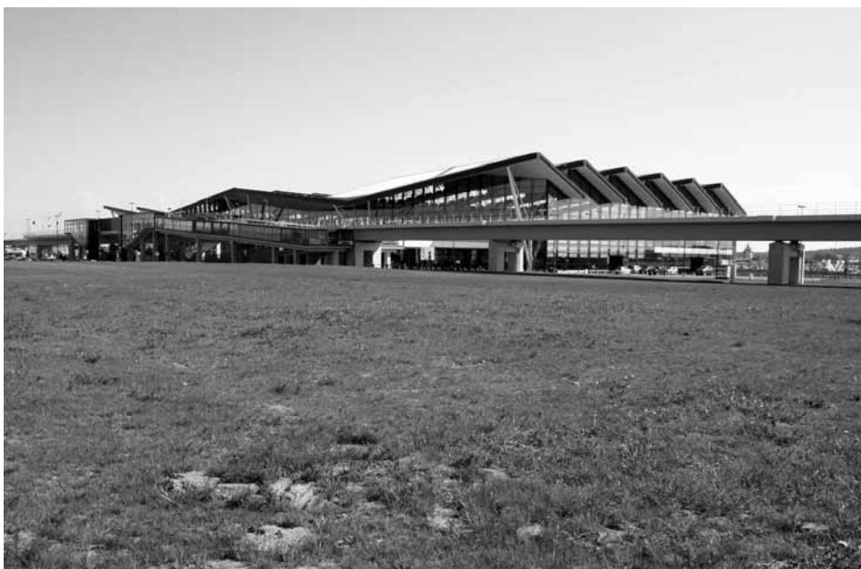
Przystanek Gdańsk Port Lotniczy zrealizowany na estakadzie, zintegrowany z terminalem lotniczym