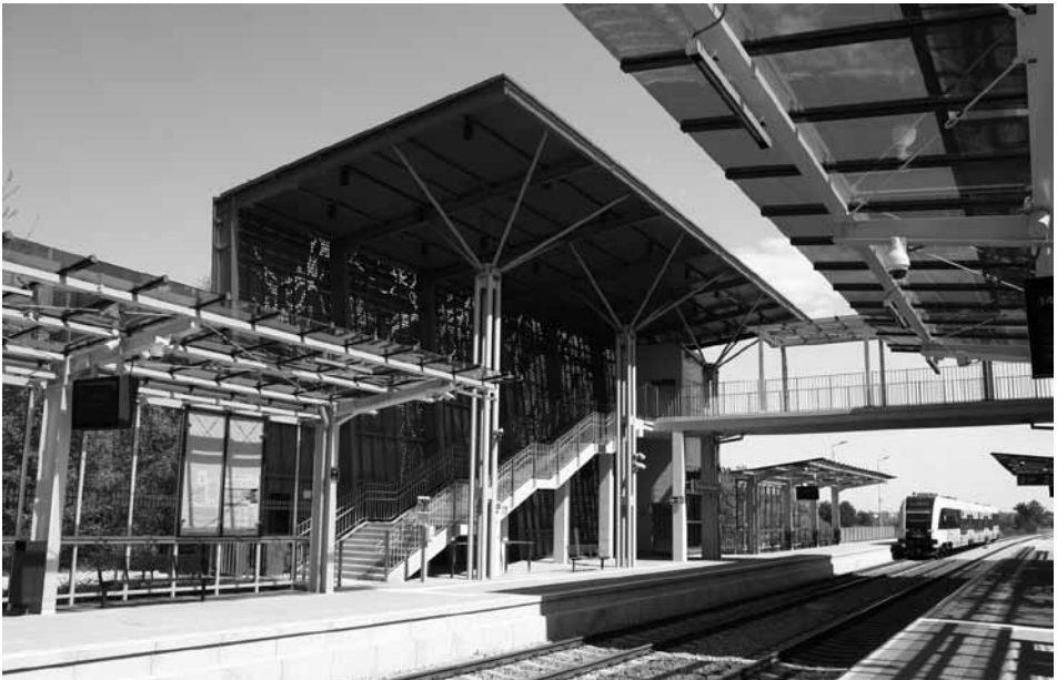
Przystanek Gdańsk Kiełpinek w miejscu dawnego przystanku na linii kokoszkowskiej