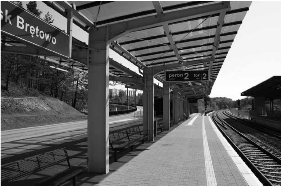
Pierwszy w Polsce przystanek Gdańsk Brętowo łączący na jednym peronie linię kolejową z linią tramwajową