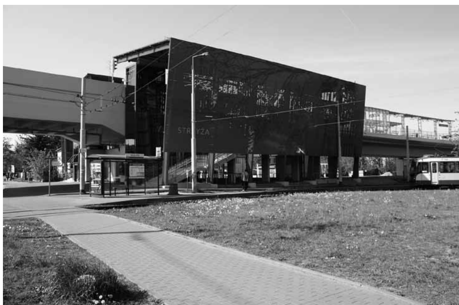
Zintegrowany z komunikacją tramwajową i autobusową przystanek Gdańsk Strzyża