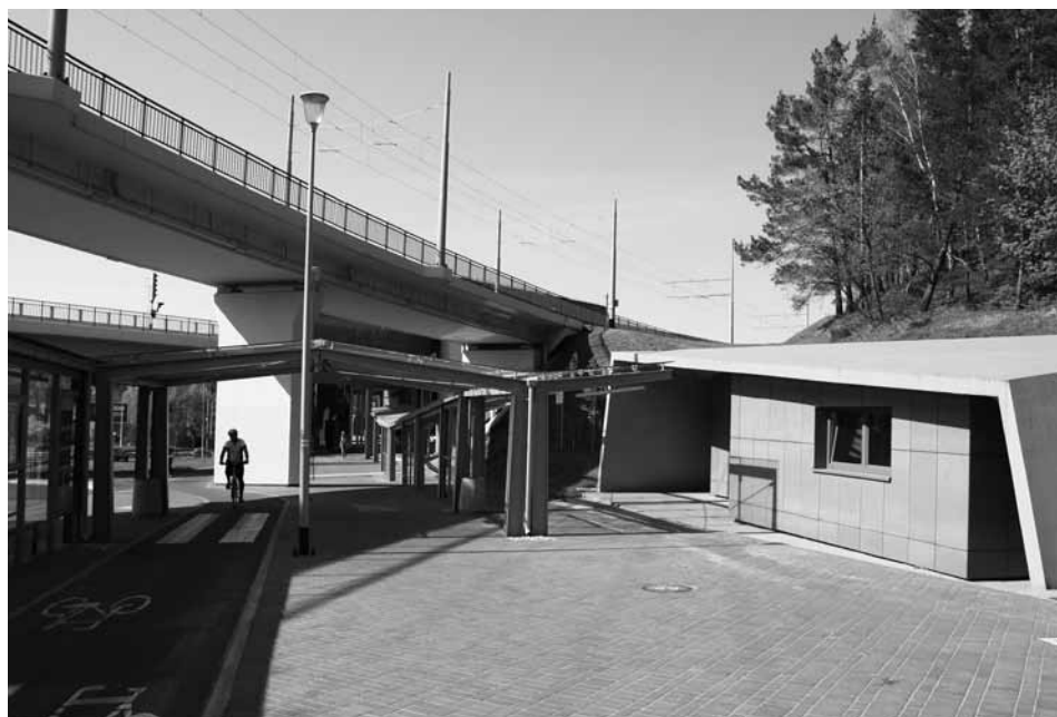
Przystanek Gdańsk Brętowo integrujący linie autobusowe, tramwajowe, kolejowe, ciągi piesze i rowerowe