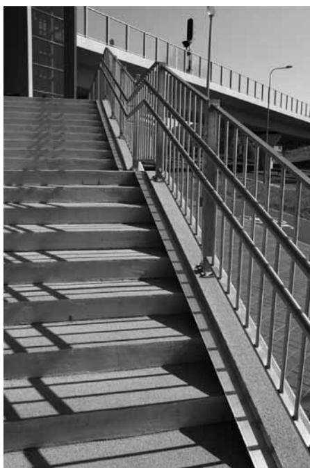
Schody ze standardowymi pochwytami dla dorosłych i dzieci oraz szyną dla rowerzystów