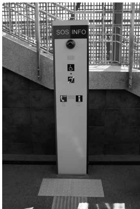
Standardowy punkt monitorujący, informacyjny i alarmowy na przystanku PKM