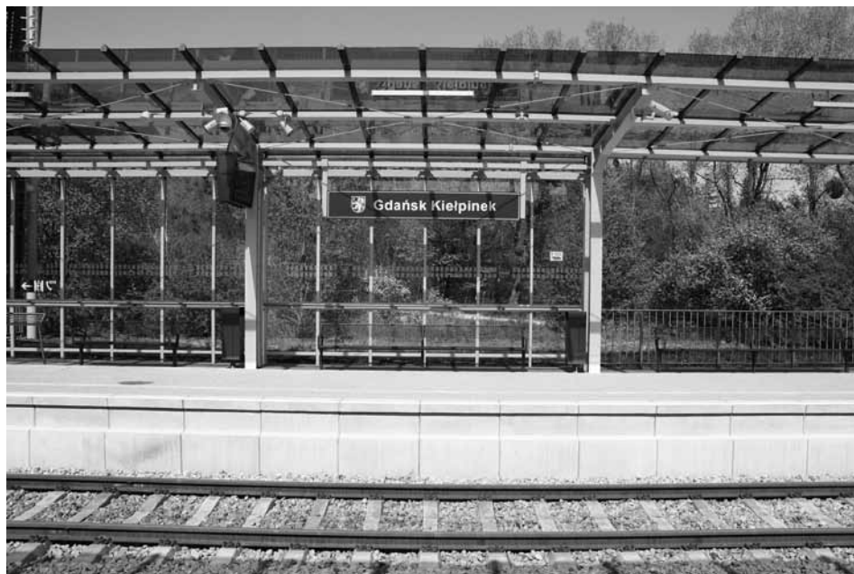
Standardowe zagospodarowanie przystanku PKM – Gdańsk Kiełpinek

W kolejnym etapie rozbudowy PKM miała połączyć Gdynię Główną z lotniskiem Gdynia-Kosakowo, by tym samym połączyć dwa międzynarodowe lotniska w obrębie aglomeracji. Lotnisko cywilne w Kosakowie budowano na bazie lotniska włoskiego do obsługi tanich linii lotniczych (2007–2014). W wyniku dochodzenia Komisji Europejskiej (2012–2014) stwierdzono, iż prognozy dotyczące ruchu lotniczego i przychodów przedstawione w biznesplanie lotniska w Gdyni nie były realistyczne, biorąc pod uwagę fakt, że port lotniczy w Gdańsku nie jest zatłoczony i znajduje się w odległości zaledwie 25 km. W takiej sytuacji żaden prywatny podmiot gospodarczy nie zdecydowałby się na inwestycję na takich samych warunkach. Uwzględniając fakt, że port lotniczy w Gdańsku efektywnie obsługuje region, wykorzystując jedynie niecałe 60 proc. swojej zdolności przepustowej, Komisja stwierdziła, że pomoc dla lotniska w Gdyni nie służy żadnemu bliżej określonemu celowi leżącemu we wspólnym interesie, jako że port ten jedynie powiela infrastrukturę, która jest niedochodowa i nie ma