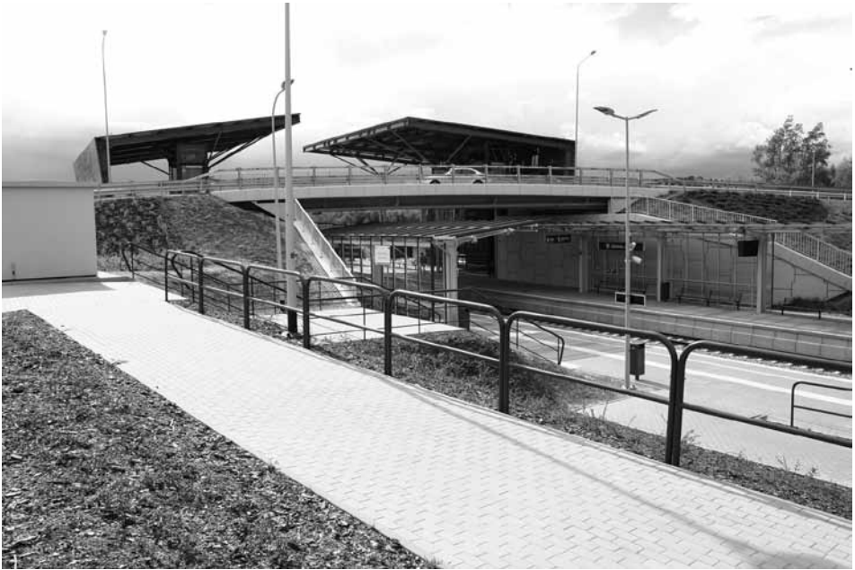
Przystanek Gdańsk Jasień obsługujący nowe osiedla mieszkaniowe na dawnym poligonie wojskowym