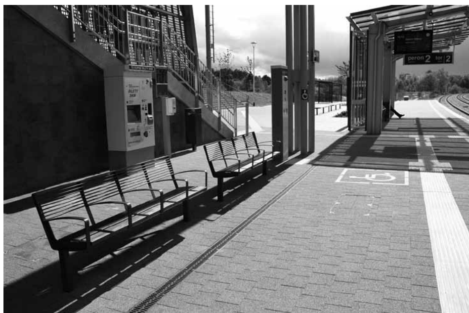
Standardowe zagospodarowanie przystanku PKM – Gdańsk Jasień (fot. D. Załuski)