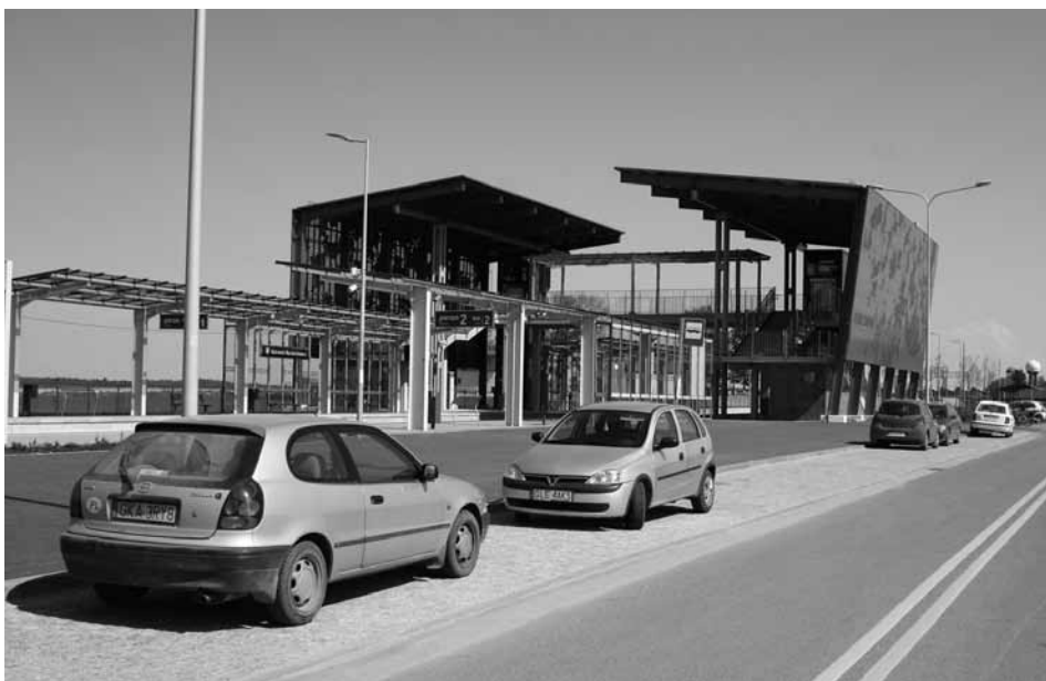
Przystanek Gdańsk Rębiechowo zintegrowany z parkingiem strategicznym Park & Ride (w budowie), mającym obsługiwać miejscowości podmiejskie