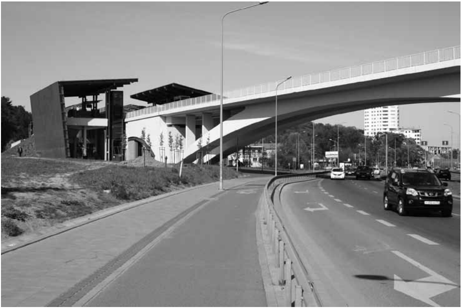
Przystanek Gdańsk Niedźwiednik nad ul. Słowackiego