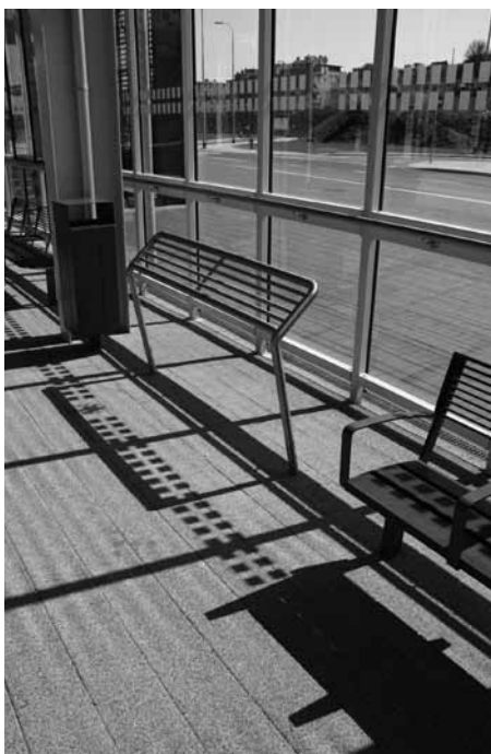
Standardowe meblowanie przystanków PKM – ławka i oparcie dla oczekujących