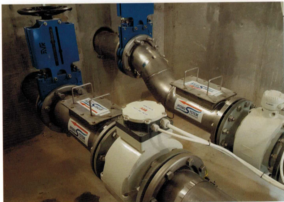
Fot. 2. Komora pomiarowa