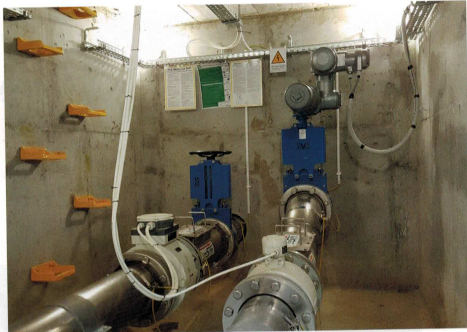
Fot. 3. Komora pomiarowa

Konstrukcja układu hydraulicznego zabudowanego w komorze pomiarowej