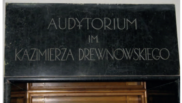
Rys. 6. Tablica przy wejściu do audytorium im. Kazimierza Drewnowskiego na I piętrze Gmachu Elektrotechniki Politechniki Warszawskiej [6]

Pamięć o prof. Kazimierzu Drewnowskim jest ciągle żywa wśród społeczności akademickiej Politechniki Warszawskiej. Jego postać przypomina m.in. tablica przy wejściu do audytorium na I piętrze Gmachu Elektrotechniki (rys. 6).