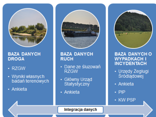
Rys. 1. Bazy danych dotyczące żeglugi śródlądowej na Dolnej Wiśle

W wyniku prowadzonych badań stworzono bazę danych integrującą dane o drodze wodnej, ruchu jednostek oraz wypadkach i incydentach (rys. 1).