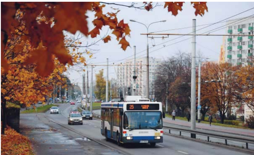
Fot. 10.jpg: Piąty egzemplarz trolejbusu MB O405N2AC z napędem asynchronicznym

Katedra Inżynierii Elektrycznej Transportu, Politechnika Gdańska, mbartlom@ely.pg.gda.pl , Przedsiębiorstwo Komunikacji Trolejbusowej sp. z o.o. w Gdyni, bartlomiejczyk@pktgdynia.pl