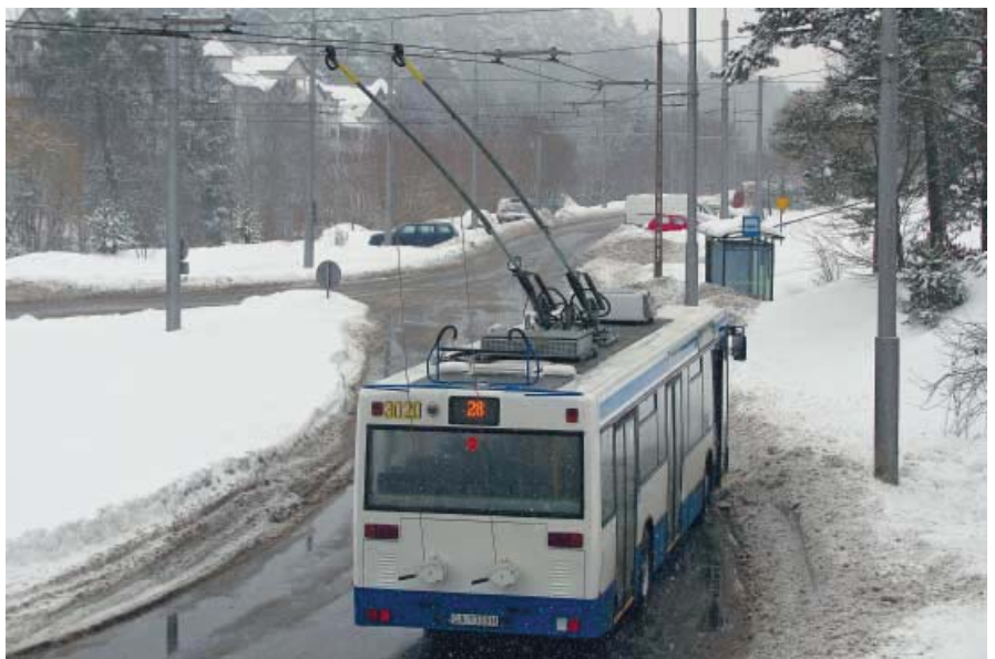
Fot. 03.jpg: Drugi egzemplarz trolejbusu MB O405N2AC z napędem asynchronicznym. Na dachu pojazdu umieszczona przetwornica statyczna, podstawa z odbierakami prądu i rezystor hamowania, nr tab. 3020 (, Gdynia, pętla autobusowo-trolejbusowa Pustki Cisowskie, 14.02.2010 r.)

Projekt konwersji autobusów na trolejbusy jest oryginalną koncepcją niskobudżetowego pozyskania znaczącej liczby trolejbusów niskopodłogowych w celu wyrównania dysproporcji jakie pojawiły się między komunikacją trolejbusową, a autobusową w Gdyni. Alternatywa budowy trolejbusów opartych o nadwozia autobusów pochodzących z rynku wtórnego względem przeprowadzania dalszych napraw głównych trolejbusów wysokopodłogowych Jelcz okazała się sukcesem ze względu na zarówno społecznych jak i ekonomicznych. Idea, która zrodziła się w 2003 r. doprowadziła do powstania 28 trolejbusów przy 85 łącznie posiadanych przez Przedsiębiorstwo Komunikacji Trolejbusowej w Gdyni (wg stanu na marzec 2011 r.), co stanowi ok. 34% całości parku taborowego.