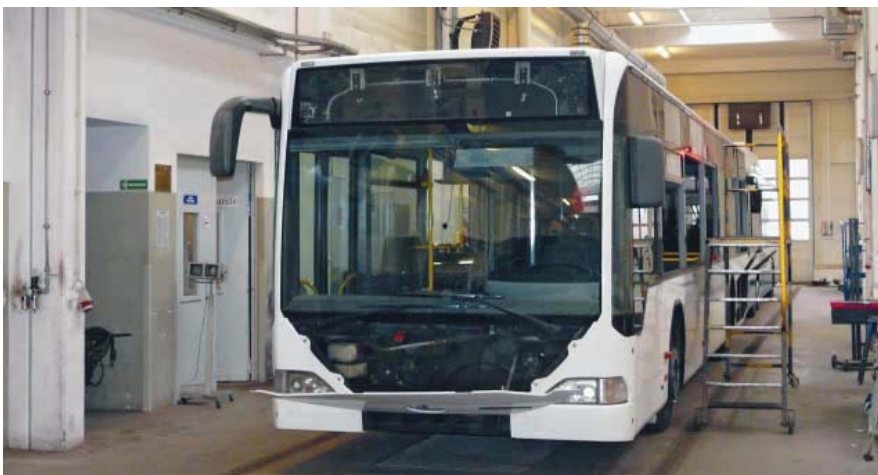
Fot. 09.jpg: Nadwozie autobusu Mercedes Benz O530 w trakcie prac dostosowawczych w procesie konwersji na trolejbus, Gdynia, zajezdnia trolejbusowa na Grabówku, 24.03.2011 r.