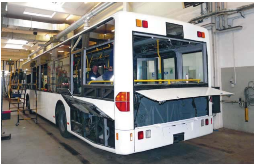
Przystosowywanie tylnej części pierwszego nadwozia Mercedes Benz O530 do zabudowy aparaturą napędu elektrycznego, Gdynia, zajezdnia trolejbusowa na Grabówku, 24.03.2011 r.