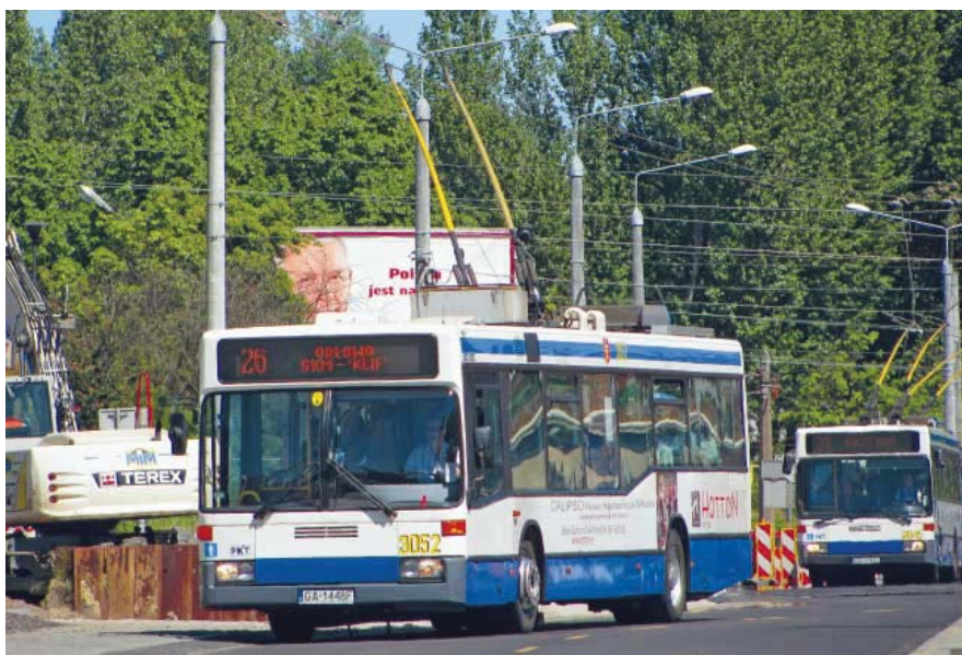
Fot 01 Jedyny egzemplarz trolejbusu MB O405N21 z napędem impulsowym. Na dachu umieszczona przed podstawą odbieraków prądu przetwornica statyczna, nr tab. 3052 (, Gdynia, al. Zwycięstwa, 04.06.2010 r.)