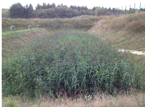
Rys. 2 Doprowadzenie osadów za pomocą rur umieszczonych z boku kwatery w Gniewinie

Przez około 30 lat systemy trzcinowe stosowane do przeróbki osadów znalazły zastosowanie w oczyszczalniach ścieków obsługujących od kilkuset do nawet 125 000 Równoważnej Liczby Mieszkańców (RLM) (Uggetti i in. 2009, Nielsen, 2003). Zatem można przyjąć, że pojemność systemów trzcinowych nie jest parametrem ograniczającym ich stosowanie. Technologia ta może być stosowana, jeśli tylko jest dostępna wymagana powierzchnia.