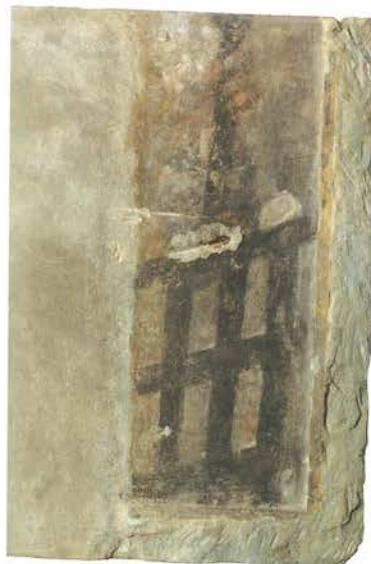
16. Barczewo. Kościół Świętego Andrzeja. Część odnalezionego w posadzce kamiennego ołtarza przegrodowego z 1626 roku, prawdopodobnie z polichromią przedstawiającą świętego Wawrzyńca trzymającego ruszt.

W 2020 roku dokonano w kościele wyjątkowego odkrycia. W posadzce znaleziono 39 elementów ołtarza architektonicznego, którego dwie okazałe części służyły do niedawna jako ozdobne kropielnice w kruchcie. Można by wiązać powstanie tego ołtarza z poświadczoną źródłowo fundacją kamiennego ołtarza z 1626 roku, administratora diecezji, kanonika warmińskiego Wawrzyńca Kocha. Nastawa mogła stanowić część optycznej przegrody, zasłaniającej objęte klauzulą prezbiterium.