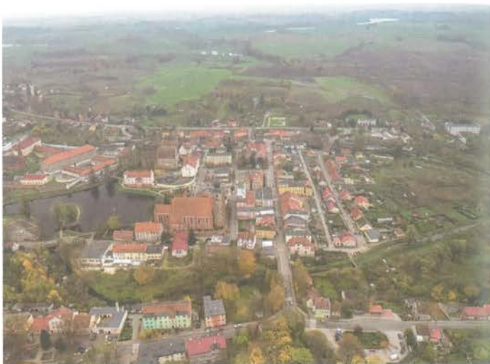
2. Barczewo. Widok z czytelnym układem architektonicznym miasta, z dominującą bryłą kościoła Świętej Anny, z kościołem Świętego Andrzeja w tle i znajdującym się na terenie dawnego folwarku franciszkańskiego zakładem penitencyjnym.

gdy resztę nieruchomości zajęło państwo. Mimo zabiegów Kościoła zabudowań nie przeznaczono na szkołę katolicką, ale przekazano ją na cele więzienia (w przeźroczu empory na pierwszym piętrze zamontowano wówczas solidne kraty, by więźniowie nie mogli uciec przez kościół). Fizyczne rozdzielanie zabudowań (zamurowanie przejść, przebudowa klasztoru na więzienie) nastąpiło w latach 1833–1836, chociaż początkowo użytkowano jeszcze zakrytą znajdującą się w skrzydle wschodnim klasztoru.