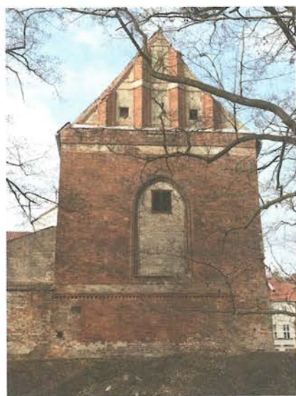
7. Barczewo. Kościół Świętego Andrzeja. Elewacja wschodnia, stan przed rozpoczęciem prac konserwatorskich w 2018 roku.

Elewacja wschodnia mimo swojego gotyckiego wyrazu nie jest jednolita. Jej najstarszy fragment stanowi relikw muru obronnego Barczewa zawierający się w jej dolnej części, wzniesiony przez biskupa Henryka Sorboma w czwartej ćwierci XIV wieku. Jest to jedyny tak dobrze zachowany fragment fortyfikacji