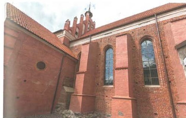
11. Barczewo. Kościół Świętego Andrzeja. Widok elewacji południowej prezbiterium, stan po ukończeniu prac konserwatorskich, 2022.

Więcej śladów pozostało do naszych czasów po oknach późniejszych – z końca XVII wieku – i ten etap został odtworzony podczas prac konserwatorskich. Odnaleziono mianowicie fragmenty środkowego drewnianego słupka, w nadmurowanych parapetach trzech okien. Oprócz tego w zastygłym tynku odcisnięty był negatyw XVII-wiecznej drewnianej ramy okiennej, w której mocowano błonę oszklenia. Według odnalezionych relikwów odtworzono kształt