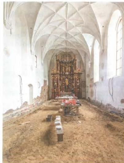
13. Barczewo. Kościół Świętego Andrzeja. Prezbiterium w trakcie prac konserwatorskich, 2021.