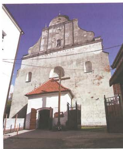
3. Barczewo. Kościół Świętego Andrzeja. Fasada, stan przed rozpoczęciem prac konserwatorskich w 2018.

Prace konserwatorskie miały na celu przywrócenie wyglądu fasady po przebudowie z końca XVIII wieku. Około 1782 roku w związku z pracami przy klasztorze postanowiono uwspółcześnić elewację zachodnią, nadając jej formę