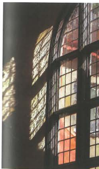
12. Barczewo. Kaplica Świętego Antoniego. Zrekonstruowane barokowe okna, 2022.

W kaplicy przywrócono okna barokowe z lat 40. XVII wieku, czyli etapu rozbudowy wcześniejszej manierystycznej kaplicy centralnej. Podczas prac usunięto XIX-wieczne zamurowanie z cegły maszynowej i odsłonięto barokowe ościeża oraz zrekonstruowano półkolisty wykrój okna. Forma ościeży i ślady w tynku świadczyły, że były to okna o masywnej drewnianej ościeżnicy, osadzonej przy licu zewnętrznym muru. W tym okresie historycznym okna miały grube słupki konstrukcyjne i poprzeczne ślemiona, tworzące podział na niewielkie kwatery. Wielkość kwater uzależniona była od technologii wytwarzania szkła. Możliwe do wykonania okazały się jedynie małe szybki, które – osadzone w gęstej siatce listew ołowianych – tworzyły ciężką błonę, uginającą się pod własnym ciężarem przy zbyt dużej rozpiętości.