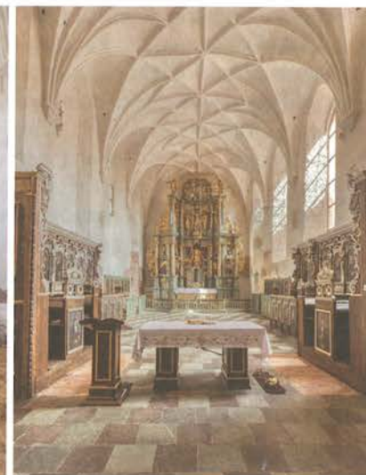
14. Barczewo. Kościół Świętego Andrzeja. Prezbiterium po zakończeniu prac konserwatorskich, 2022.