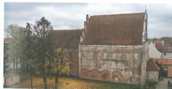
5. Barczewo. Kościół Świętego Andrzeja. Widok elewacji północnej, stan przed rozpoczęciem prac konserwatorskich w 2018 roku.

Elewacja północna jest świadectwem skomplikowanej historii kościoła, ale też podstawowym źródłem dla rekonstrukcji układu przestrzennego rozebranego klasztoru, który do niej przylegał. Z tego powodu początkowo nie było w niej żadnych okien.