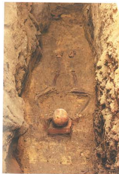
18. Barczewo. Kościół Świętego Andrzeja, prezbiterium. Pochówek jednego z braci barczewskiego konwentu, w pozycji na wznak, ze złożonymi dłońmi, z głową od strony zachodniej i z włożoną pod głowę zmarłego cegłą, kwiecień 2019.

Badania archeologiczne w bezpośrednim otoczeniu i w prezbiterium kościoła Świętego Andrzeja dostarczyły dowodów intensywnego osadnictwa u schyłku wędrówek ludów i prognozy wczesnego średniowiecza związanych z tzw. grupą olszyńską (około VII/VIII wieku). W 2010 roku w trakcie rewitalizacji południowej części miasta na terenie poklasztornej odsłonięto fragmenty nowożytnego cmentarza przykościelnego (XVII–XVIII wiek) i ewakuowano kilkadziesiąt pochówków, które poddano badaniom, a następnie ponownie pochowano w odrestaurowanej w 2021 roku krypcie w prezbiterium kościoła. Podczas realizacji prac konserwatorskich nadzory archeologiczne i badania ratunkowe w prezbiterium prowadził dr Arkadiusz Koperkiewicz, a w nawie i na zewnątrz kościoła dr Jacek Wsocki. Wykopy lokalizowano wzdłuż ścian, gdzie styki nawarstwień kulturowych byłyby zniszczone odwiertami wzmacniającego fundamentowania. Udokumentowano układ stratygrafii kulturowej, poczynając od najwcześniejszych faz średniowiecza. Najstarsze (najniższe) warstwy zawierają intensywne ślady początków osadnictwa średniowiecznego, pogorzelniska, pokonsumpcyjne szczątki zwierzęce, liczne fragmenty średniowiecznej ceramiki.