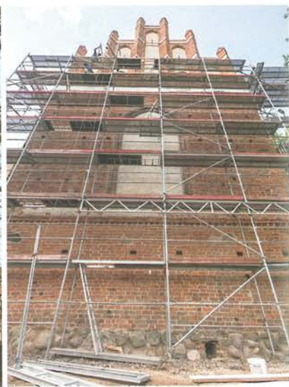
8. Barczewo. Kościół Świętego Andrzeja. Elewacja wschodnia w trakcie prac konserwatorskich, podczas rekonstrukcji zwieńczenia szczytu, 2022 roku.

średniowiecznych miasta. Od zewnętrznej strony mur został zwieńczony fryzem z ząbkowaniem i pasem tynku zapewne dodatkowo dekorowanym malowanym ornamentem. Powyżej znajdowały się blanki.