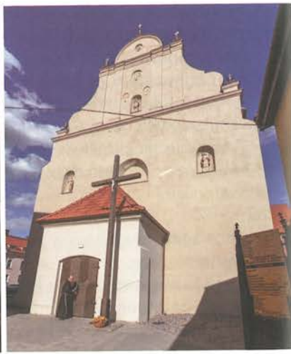
4. Barczewo. Kościół Świętego Andrzeja. Prace konserwatorskie elewacji zachodniej pozwoliły przywrócić wygląd fasady po przebudowie z 1782 roku, wraz z rekonstrukcją niezachowanych metalowych waz na zwieńczeniu, 2022.

późnobarokową. Kompletnie przebudowano szczyt, dodając spływy i eliptyczne medaliony oraz naczółek. Po bokach blendy po zamurowanym oknie zachodnim wykuto półkoliste nisze. Ponadto w przyziemiu dodano kruchte osłaniającą wejście do kościoła, zamkniętą prostym szczytem nawiązującym już do klasycyzmu.