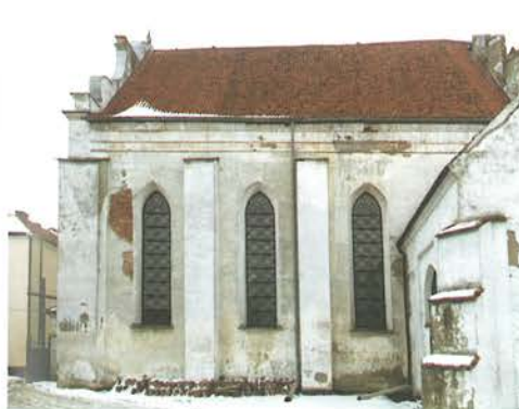
9. Barczewo. Kościół Świętego Andrzeja. Elewacja południowa korpusu, w całości pokryta cementowym tynkiem, stan przed rozpoczęciem prac konserwatorskich w 2018 roku.

Elewacja południowa w średniowieczu i epoce nowożytnej wychodziła na ogród należący do zakonników. To w niej znajdowały się okna doświetlające wnętrze kościoła.