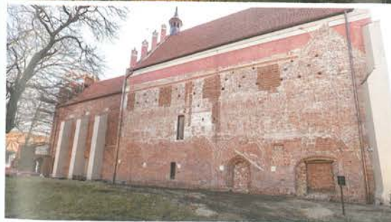
6. Barczewo. Kościół Świętego Andrzeja. Elewacja północna będąca świadectwem skomplikowanej historii architektonicznej klasztoru i kościoła, stan po konserwacji w 2022 roku.