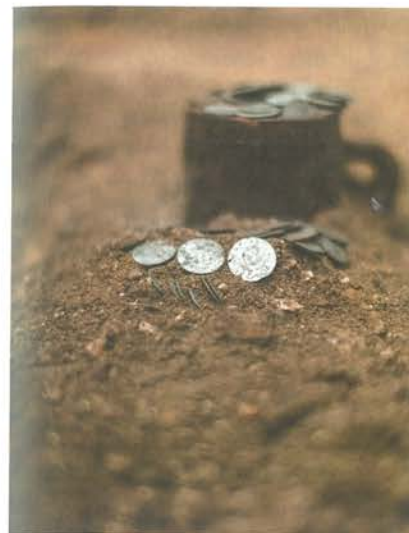
15. Barczewo. Kościół Świętego Andrzeja. Skarb składający się z 1084 sztuk srebrnych monet odnaleziony w trakcie demontażu posadzki z początku XVII wieku, pod stallami, kwiecień 2020.

Depozyt składał się z 1084 sztuk monet o łącznej wadze niemal kilograma. Większość to drobniejsze nominały monet polskich, pruskich, a także szwedzkich. Pochodzą głównie z mennic króla polskiego Zygmunta III (szelągi koronne i półtoraki) i księcia pruskiego Jerzego Wilhelma Hohenzollerna (szelągi). W dużo mniejszej liczbie wystąpiły grosze koronne, dwudenary litewskie i szelągi Gustawa II Adolfa. Najmłodsza z monet datowana jest na 1629 rok. Przyczyną tezauryzacji mogła być tzw. wojna pruska (1626–1635 ze słynnym epizodem bitwy oliwskiej), która bardzo silnie dotknęła Warmię. Prawdopodobnie są to indywidualne datki kościelne, a nie część dużego funduszu na