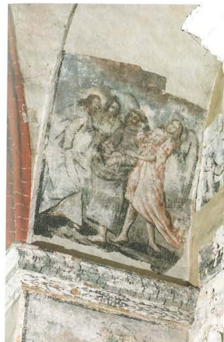
19. Barczewo. Kościół Świętego Andrzeja, kaplica Świętego Franciszka. Odsłonięta w trakcie prac dekoracja malarska ściany północnej korpusu nawowego w arkadzie bocznej kaplicy, związana z istnieniem bractwa tercjarskiego. Scena „Święty Franciszek w drodze do Porcjunkuli w towarzystwie aniołów”.

Pierwszy nowożytny ołtarz pod wezwaniem świętego Franciszka z Asyżu w kościele Bernardynów w Barczewie konsekrowano w 1656 roku. Jego wygląd nie jest dzisiaj znany. Do naszych czasów zachował się jedynie umieszczony w późniejszej nastawie obraz przedstawiający stygmatyzację świętego Franciszka oraz polichromia namalowana na ścianie i filarach wokół ołtarza.