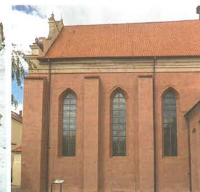
10. Barczewo. Kościół Świętego Andrzeja. Elewacja wschodnia, stan po konserwacji z rekonstrukcją kolorowych tynków, trzech dużych okien i sygnaturki, 2022 roku.

Elewacja nawy z okresu średniowiecza nie była tynkowana i zachowała się jedynie w partii przyziemia. Okna, mimo zamknięcia ich ostrołucznie, powstały dopiero na początku XVII wieku. Odbudowana wtedy świątynia została niemal w całości pokryta cienkim czerwonym tynkiem. Relikty oryginalnej XVII-wiecznej wyprawy leżącej na licu cegieł można zobaczyć w wielu miejscach elewacji, gdyż zostały poddane konserwacji i pozostawione jako świadki.