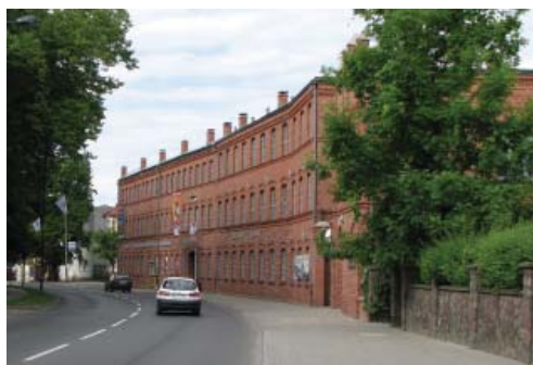
Fot. 2. Dawna Fabryka Wyrobów Metalowych Emila Kelcha, obecnie Centrum Wystawienniczo-Regionalnego Dolnej Wisły „Fabryka Sztuk”

stracili miejsca pracy, znalazło lub samodzielnie zorganizowało sobie zatrudnienie w usługach i drobnym handlu. Działalność ta była jednak lokowana przede wszystkim w zachodniej części miasta oddzielonej od Starego Miasta magistralą kolejową. Na utratę dotychczasowej roli historycznego centrum miała również wpływ lokalizacja wielkich obiektów handlowych na obrzeżach miasta. Malowniczo położone na skarpie nadwiślańskiej historyczne centrum miasta uległo marginalizacji, której towarzyszyły patologie społeczne oraz zły stan techniczny przestrzeni publicznych wraz z otaczającą je historyczną zabudową [Lokalny Program Rewitalizacji... 2009].