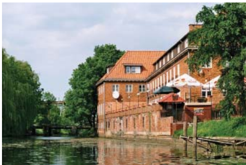
Fot. 6. Gmach starostwa w Nowym Dworze Gdańskim z mostem zwodzonym w tle

Celem nowego wizerunku miasta jest przede wszystkim wzmocnienie roli stolicy powiatu zgodnej z założeniami reformy terytorialnej – tj. centrum, z którym utożsamiają się mieszkańcy miasta i okolicznych gmin. Wobec skali i wyrazistości wizerunkowej pobliskich miast – Malborka i Elbląga – wykorzystano niszę wynikającą z braku wyrazistego ośrodka kultuwującego i promującego dziedzictwo Żuławy Wiślanej. Dzięki działalności „Klubu Nowodworskiego” i powołaniu Żuławskiego Parku Historycznego udało się wytworzyć nową narrację miejsca – adresowaną przede wszystkim do społeczności lokalnej, jednocześnie stanowiącą ważne uzupełnienie produktów turystycznych dotyczących obszaru Deltę Wisły (np. „Pętla Żu-