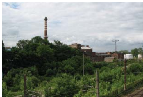
Fot. 5. Wyłączona z produkcji cukrownia w Pruszczu Gdańskim