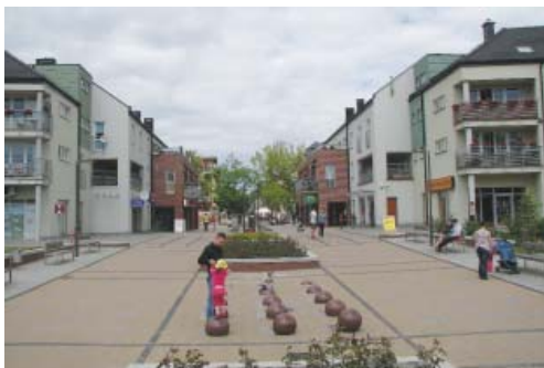
Fot. 4. Aleja ks. Wałęga – nowe centrum Pruszcza Gdańskiego

Nowym projektem realizowanym w Pruszczu Gdańskim, którego sama formuła niesie ze sobą silny wątek wizerunkowy, jest projekt stworzenia społecznej koncepcji zagospodarowania przestrzennego terenów dawnej cukrowni „Strefa Cukru”. Przedmiotem projektu jest obszar o powierzchni 20 ha wraz z zabytkowymi zabudowaniami cukrowni (fot. 5). Zespół położony w centralnej części miasta został wyłączony z produkcji w 2004 r. [www.strefacukru.pl 2012]. Początkowo władze miasta zakładały adaptację zespołu na funkcje usługowe, jednak w miarę trudności z pozyskaniem inwestora zdecydowano się na zmianę przeznaczenia terenu na obszary mieszkaniowe, co jednak również nie przyniosło oczekiwanych rezultatów. Miasto nie jest właścicielem terenu co z założenia ogranicza możliwość lokalizacji usług