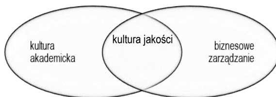
Rys. 2. Kultura jakości w szkołach wyższych

Według Europejskiego Stowarzyszenia Uniwersytetów (ang. European University Association, EUA) kultura jakości łączy w sobie dwa odrębne zestawy elementów: kulturowe oraz organizacyjne. Do elementów kulturowych można zaliczyć: wspólne podzielenie wartości, przekonań i oczekiwań odnoszących się do jakości, zaś elementami organizacyjnymi są: strukturalno-zarządczy system wraz ze zdefiniowanymi procesami, które wzmacniają jakość i mają na celu koordynację działań [8], czyli strategie, wewnętrzne systemy zapewniania i doskonalenia jakości oraz zdefiniowana struktura organizacyjna.