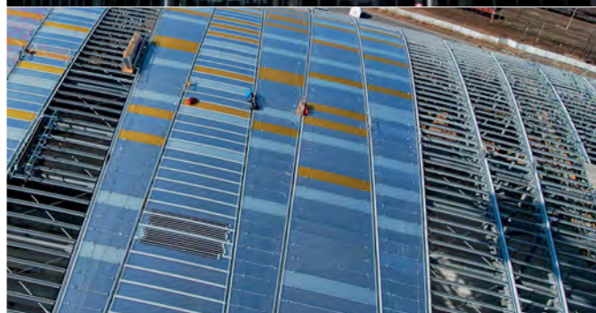
Rys. 1. Przykłady dowolnego kształtowania bryły obiektów z lekką obudową a) obiekt wysoki kubaturowy, b) przekrycie wejścia do pasażu podziemnego, c) fasada ściana i przekrycie dachowe zadaszenia obiektu sportowego [4, 6, 7]