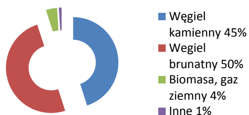
Rys. 1. Możliwości produkcji wodoru w Polsce (100% = 37 mln ton/rok)

Taka konstrukcja umożliwia dopasowanie zdolności produkcyjnych wodoru do potrzeb, jednak ogranicza korzyści z efektu skali, bo nawet duże elektrolizery zawierają komórki i stosy o identycznej średnicy.