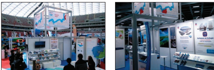
Rys. 4. Stoisko promocyjne South Coast Baltic podczas targów w Warszawie i Berlinie

Wspólne uczestnictwo w targach branżowych było widocznym znakiem transgranicznej współpracy regionów pod marką South Coast Baltic , promującej porty jachtowe i żeglarsstwo wzdłuż południowego wybrzeża Bałtyku (rys. 4).