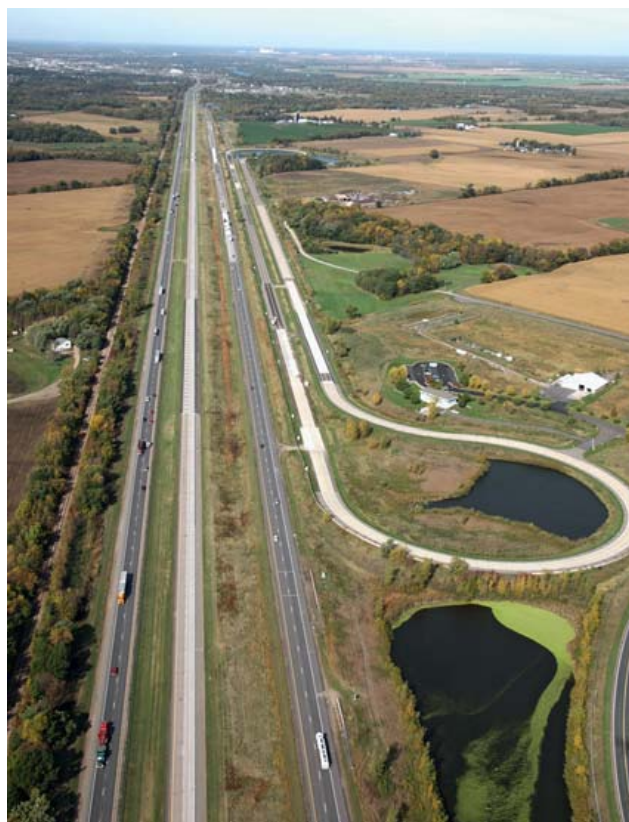
Rys. 5. MnRoad Facility w stanie Minnesota, USA. Widok na tor doświadczalny Mainline – trzecia nitka autostrady, licząc od lewej strony, oraz na LVR – tor w kształcie spłaszczonego w środkowej części okręgu. Na rysunku widoczny jest również by-pass (druga nitka autostrady od strony lewej) wykorzystywany w okresach zamykania dla ruchu toru Mainline. Na rysunku nie jest widoczny tor Farm Loop, który jest zlokalizowany w dół od dolnej krawędzi zdjęcia.

Wydział Mechaniczny Politechniki Gdańskiej od 2010 roku współpracuje z naukowcami pracującymi w MnRoad Facility. W 2011 roku w oparciu o projekt sponsorowany przez DOT ekipa Politechniki pojechała do Minnesoty na pierwszą turę