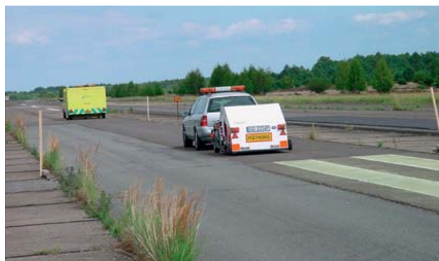
Rys. 2. Odcinki doświadczalne na opuszczonym lotnisku Sperenberg w Niemczech wykorzystywane kilkanaście lat temu do badań hałasu opon