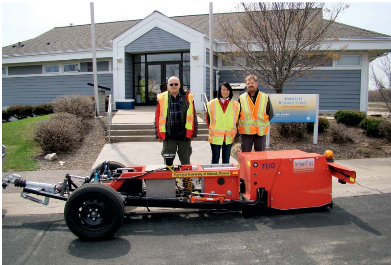
Rys. 7. Przyczepa do badania oporu toczenia R 2 Mk. 2 wraz z ekipą pomiarową podczas badań w MnRoad Facility w 2014 roku

► w 2013 roku (rys. 7). Badania w USA były pierwszym poważnym sprawdzeniem nowego urządzenia, co oczywiście powodowało spore emocje, bo w przypadku poważniejszej awarii naprawa na terenie USA mogła być bardzo trudna, a nawet całkowicie niemożliwa. Na szczęście przyczepa nie sprawiała kłopotów, za wyjątkiem zasilania w energię elektryczną z samochodu ciągnącego, który dostarczyli Amerykanie. Samochód nie miał odpowiednio wzmocnionej instalacji elektrycznej i konieczne było ciągnięcie dodatkowych przewodów od alternatora do tylnego zderzaka.