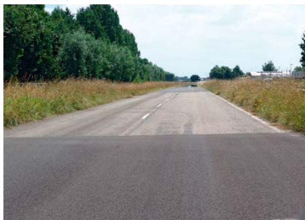
Rys. 3. Odcinki doświadczalne na wyłączonym z ruchu fragmencie drogi w miejscowości Kloosterzande, Holandia