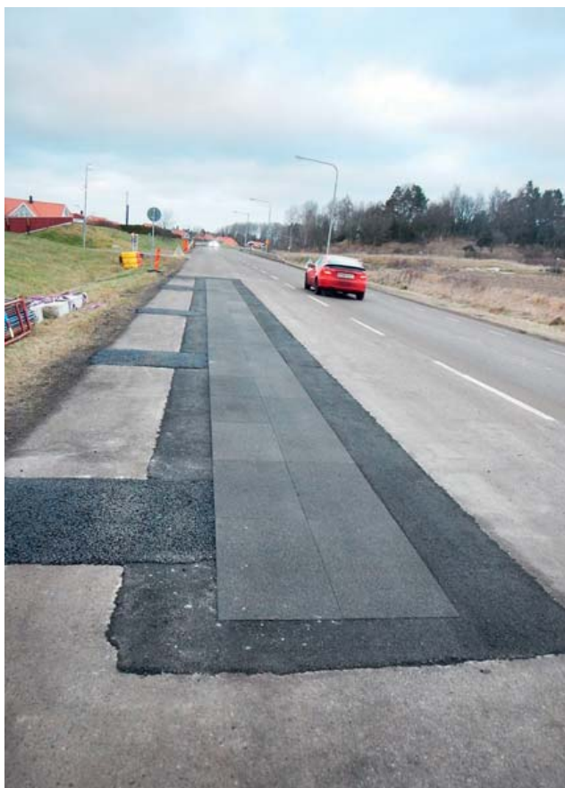
Rys. 1. Odcinek doświadczalny pokryty nawierzchnią poroelastyczną PERS-HET usytuowany na jednej z ulic w mieście Linköping, Szwecja