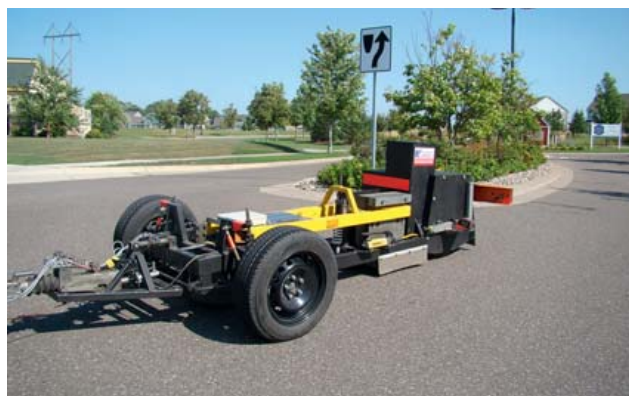
Rys. 6. Przyczepa do badania oporu toczenia R 2 w MnRoad Facility, 2011

badania drogowych oporu toczenia. Przyczepa doświadczalna R 2 (patrz rys. 6) została przetransportowana samolotem do Stanów Zjednoczonych, gdzie była wykorzystana do badania oporu toczenia trzech opon samochodowych na torach Mainline i LVR oraz na kilku odcinkach drogowych w stanie Minnesota. Oprócz badania oporu toczenia prowadzone były przez stronę amerykańską badania tekstury i hałasu. Wyniki pomiarów po ich opracowaniu zostały udostępnione w raporcie końcowym [1].