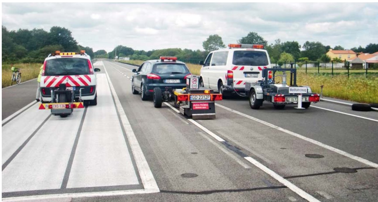
Rys. 4. Badania oporu toczenia prowadzone na odcinkach testowych na torze doświadczalnym IFSTAR, Nantes, Francja