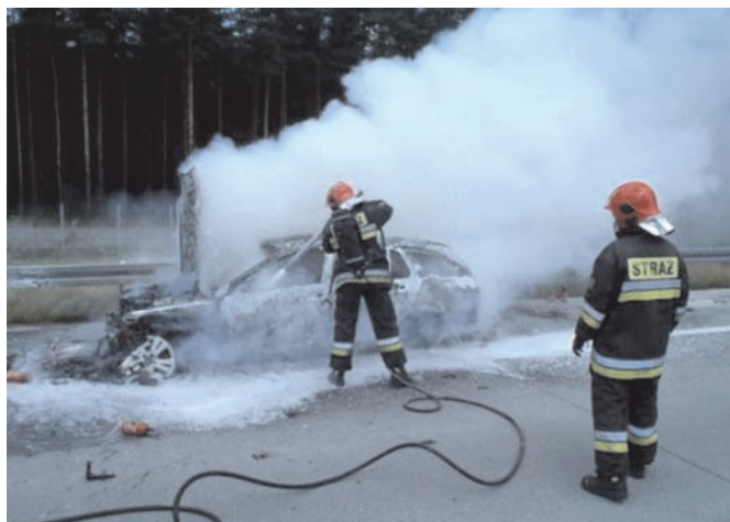
Rys. 3. Widok pojazdu spalonego w wyniku prawdopodobnie zwarcia w instalacji elektrycznej

O tym, że rozbudowana instalacja elektry-