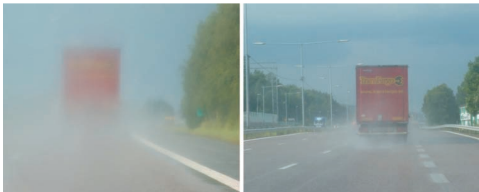
Rys. 6. Wpływ nawierzchni drenażowej na zjawisko rozbryzgiwania wody przez koła pojazdów (zdjęcia wykonane zostały w odstępie kilkunastu sekund, lewe – przed wjazdem, a prawe – po wjeździe pojazdu na odcinek pokryty nawierzchnią drenażową)

swobodny przepływ powietrza i cieczy. Taka struktura nawierzchni ma wiele zalet, z których najważniejsze, to mniejszy hałas opon, znaczna poprawa przyczepności w warunkach intensywnych opadów oraz niemal całkowite wyeliminowanie zjawiska rozbryzgu wody przez koła samochodów jadących w czasie intensywnych opadów (rys. 6). Nawierzchnie drenażowe są stosowane coraz częściej w wielu krajach Europy oraz w Japonii i USA.