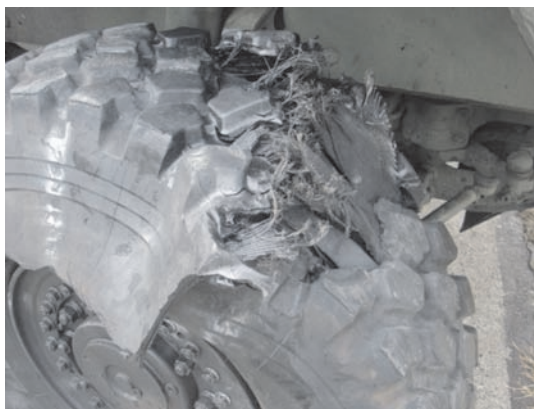
Rys. 1. Widok opony uszkodzonej w sposób kontrolowany podczas badań kierowności i stateczności pojazdów wieloosiowych, prowadzonych m.in. przez autorów artykułu

Uszkodzenie opony, szczególnie w samochodach ciężarowych i autobusach (patrz rys. 1) może spowodować w tunelu poważne konsekwencje, destabilizując tor