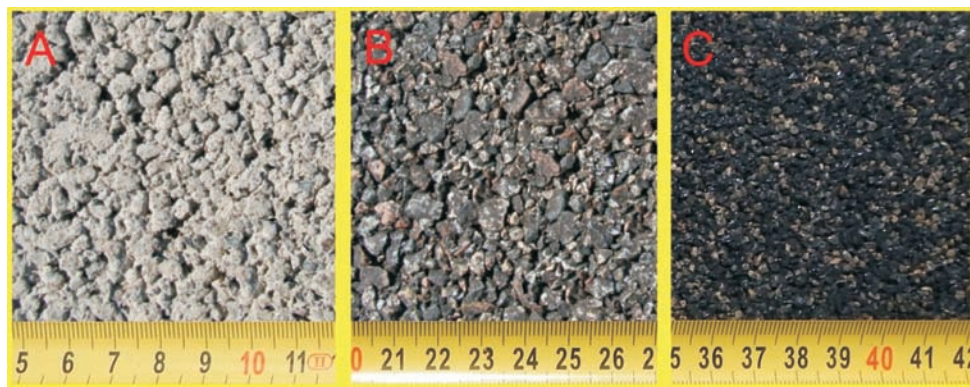
Rys. 7. Trzy typy nawierzchni porowatych A – porowaty beton cementowy, B – porowaty beton asfaltowy, C – nawierzchnia poroelastyczna (PERS)

Od kilku lat trwają intensywne prace nad nowym typem nawierzchni drenażowych nazwanym PERS. W nawierzchniach tych zamiast lepiszcza asfaltowego lub cementowego wykorzystywane są żywice poliuretanowe, a część granulatu mineralnego zastąpiona jest granulatem gumowym. W rezultacie uzyskiwana jest nawierzchnia porowata o dużej elastyczności. Na rys. 7 przedstawiono nawierzchnie drenażowe z lepiszczem cementowym (A), bitumicznym (B), oraz nawierzchnię poroelastyczną (C).