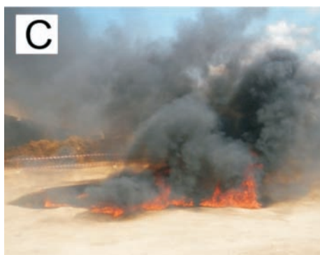
Rys. 5. Pożar paliwa rozlanego na betonowej nawierzchni drogowej A – kałuża powstała z rozlania 20 dm 3 benzyny 95-oktanowej, B – pożar benzyny po 10. sekundach od zapłonu, C – pożar benzyny po 60. sekundach od zapłonu

swobodny przepływ powietrza i cieczy. Taka struktura nawierzchni ma wiele zalet, z których najważniejsze, to mniejszy hałas opon, znaczna poprawa przyczepności w warunkach intensywnych opadów oraz niemal całkowite wyeliminowanie zjawiska rozbryzgu wody przez koła samochodów jadących w czasie intensywnych opadów (rys. 6). Nawierzchnie drenażowe są stosowane coraz częściej w wielu krajach Europy oraz w Japonii i USA.