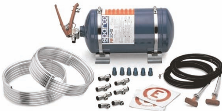
Rys. 4. System gaśniczy pojazdów rajdowych wg regulaminu FIA

o masie 1 kg. Sytuacje takie stosunkowo często występują na autostradach, gdzie pojazdy długo eksploatowane w warunkach miejskich, zużyte eksploatacyjnie i z licznymi wyciekami płynów eksploatacyjnych, wyjeżdżają na autostradę i poruszają się z dużymi prędkościami, co powoduje silne rozgrzanie elementów układu wydechowego. Doświadczenia autorów artykułu wskazują, że nawet bardziej rozbudowane systemy gaśnicze pojazdów, np. w pojazdach sportowych (rys. 4) nie są w stanie poradzić sobie z dużym pożarem pojazdu w opisanej wyżej sytuacji zapłonu oleju.