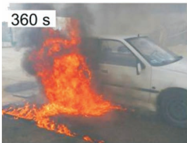
Rys. 8. Kolejne fazy pożaru samochodu stojącego na nawierzchni PERS nasączonej 20 litrami benzyny silnikowej (czas podany w sekundach)

W opinii osób obserwujących eksperyment, gdyby nawierzchnia poroelastyczna miała większą powierzchnię i paliwo nie wyciekło na nawierzchnię betonową, to prawdopodobnie pojazd nie uległby zapaleniu!