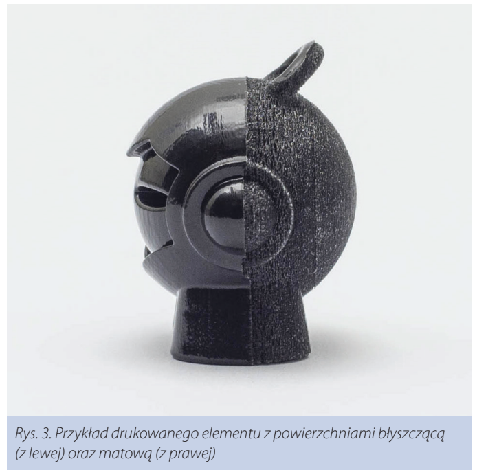
Rys. 3. Przykład drukowanego elementu z powierzchniami błyszczącą (z lewej) oraz matową (z prawej)

prezentowano na rysunku 3. W przypadku drukowania części o błyszczących powierzchniach materiał podporowy stosowany jest tylko wtedy, gdy jest to konieczne ze względów konstrukcyjnych, np. podczas drukowania elementów wystających i niemających bezpośredniego kontaktu z podłożem platformy roboczej. Podczas drukowania elementów o powierzchniach matowych, bez względu na ich orientację oraz wymagania konstrukcyjne, dodawana jest całościowo cienka warstwa materiału podporowego. Drukowanie modeli błyszczących pozwala na uzyskanie bardzo gładkiej powierzchni. Do podstawowych wad tego rozwiązania należą natomiast nierównomierne wykończenie wydrukowanych powierzchni oraz powstające lekkie zaokrąglenia w miejscach występowania ostrych krawędzi oraz narożników. Części o matowych powierzchniach powinny być wykonywane w przypadkach, gdy wymagana jest wysoka dokładność oraz jednolite wykończenie wydrukowanych powierzchni. Wymagany jest również dodatkowy czas przeznaczony na usunięcie materiału podporowego. Ponadto elementy o powierzchniach matowych, w porównaniu do