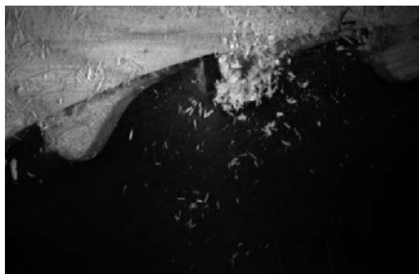
Powstawanie wiórów podczas przecinania sosny suchej i zmrożonej piłą tarczową (po lewej – drewno suche, po prawej – drewno zmrożone).

– We współczesnym przerobie drewna przepływ surowca powinien być „inteligentny”, począwszy od jego pozyskania w lesie – mówił fiński naukowiec. – To oznacza, że powinno się zastosować nowe podejście, w którym zawarte byłyby informacje o jakości surowca, jego źródle pochodzenia, a także właściwościach wytrzymałościowych materiału drzewnego, mogące wspomagać współdziałanie pomiędzy producentem a zorientowanym odbiorcą. Znaczący wpływ na wydajność materiałową ma stosowany system podziału dłużyć na kłody, który powinien uwzględniać głównie jakość surowca. Ta może być dokładnie poznana nie tylko na podstawie