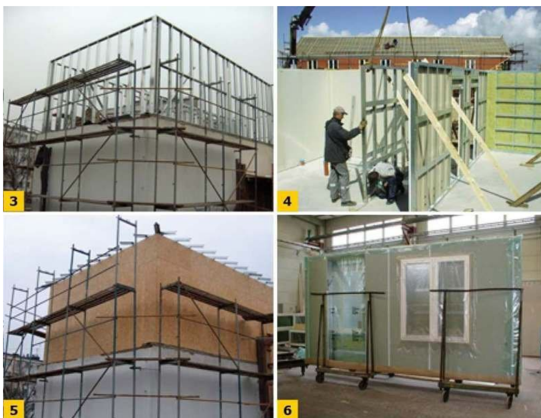
FOT. 3-6. Różne poziomy prefabrykacji: montaż z pojedynczych elementów (3), montaż gotowego szkieletu ściany (4), obudowanie szkieletu płytami OSB (5), prefabrykacja panelu ściennego (6); Fot. "Systemy suchych konstrukcji stalowych w budownictwie", Materiały vol. 6. Warszawa 2006

Wybrane przykłady przedstawiają FOT. 3-6.