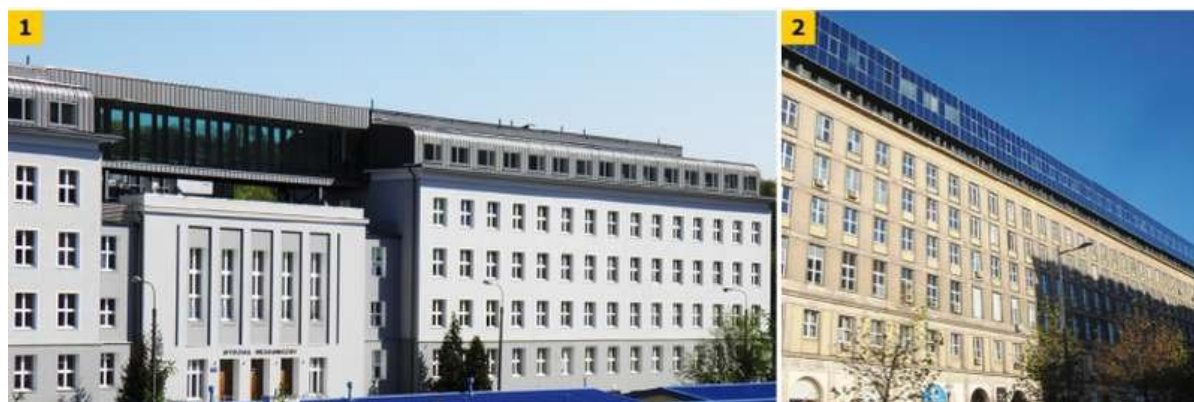
FOT. 1-2. Przykłady zrealizowanych nadbudów obiektów: budynek kampusu Politechniki Gdańskiej (1), budynek użyteczności publicznej - Warszawa, ul. Świętokrzyska (2)