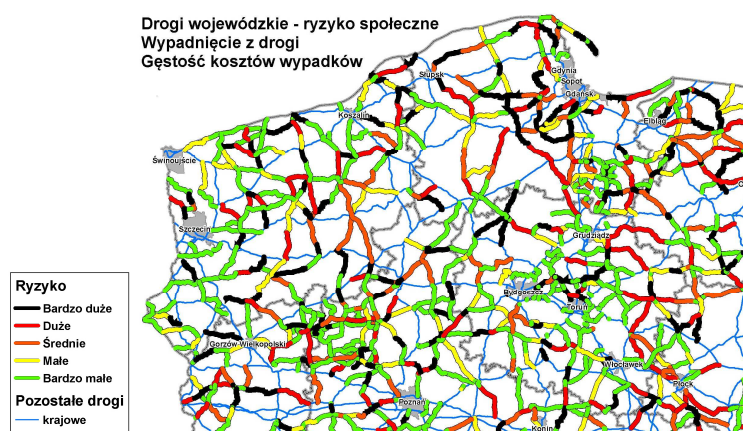
Rys. 2. Mapa odcinków dróg woj., ryzyko społeczne, wypadnięcia z jezdni

W przyjętej klasyfikacji poziomu bezpieczeństwa ruchu proponuje się pięć klas potencjału redukcji kosztów wypadków na odcinkach dróg (A, B, C, D, E) [3]. Pomimo, że klasyfikacja odcinków niebezpiecznych dotyczy obligatoryjnie tylko dróg krajowych, w roku 2015 opracowano na zlecenie Krajowej Rady BRD, klasyfikację odcinków niebezpiecznych dla dróg wojewódzkich [6]. Na rys. 2 przedstawiono, jako przykład takiej klasyfikacji, ryzyko społeczne (gęstość kosztów wypadków) dla wypadków typu wypadnięcie z drogi.