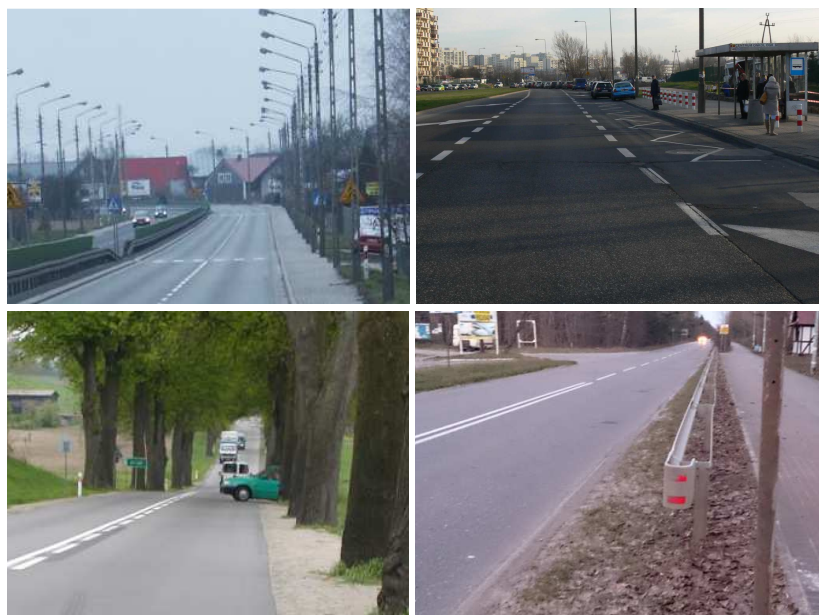
Rys. 3. Przykłady zagrożeń na sieci istniejących dróg

C – duże zagrożenie). Obecnie trwają prace nad przyjęciem obiektywnych miar oceny zagrożenia na drogach, konieczne jest określenie wpływu prędkości i natężenia ruchu drogowego na klasę zagrożenia. Efektem prowadzonych badań będzie narzędzie umożliwiające obiektywne klasyfikowanie identyfikowanych podczas kontroli zagrożeń na drodze i w jej otoczeniu.