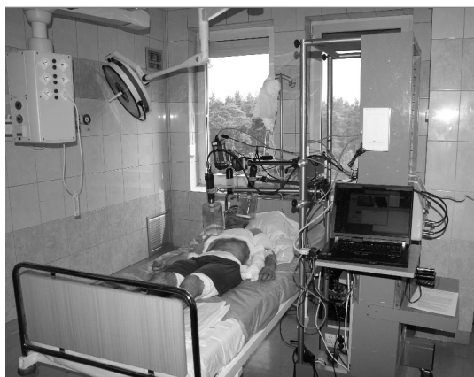
Rys. 3. Stanowisko pomiarowe ADT w warunkach klinicznych badań oparzeń Fig. 3. ADT set in clinical measurements of burns