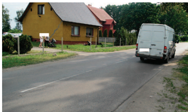
Przykładowy budynek badany pod kątem wpływu drgań wywołanych ruchem drogowym

An example building tested for the impact of traffic-induced vibrations