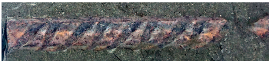
Fot. 6. Widok na pręt bez ochrony katodowej, widoczna korozja całej powierzchni pręta