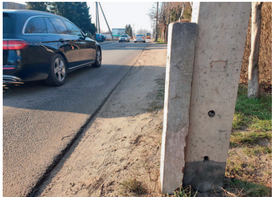
Fot. 3. Widok na próbkę żelbetową z zatopionymi prętami z protektorem

Badania (podobnie jak w [14]) polegały na comiesięcznym pomiarze potencjałów korozyjnych zarówno pręta chronionego protektorem, jak i pręta bez ochrony katodowej. Na rys. 2 przedstawiono wartości pomierzonych potencjałów w okresie 120 miesięcy. Należy zaznaczyć, że w okolicy 77. miesiąca, czyli po około 6 latach ekspozycji, na powierzchni betonu próbki pojawiły się mikrozarysowania, które pozwalały na głębszą penetrację wody i chlorków. Analizując wykres pomierzonych potencjałów korozyjnych pręta chronionego, widać, jak w pierwszych miesiącach potencjał systematycznie spadał. Po około 7 miesiącach ustabilizował się on na poziomie -550 mV i później, w zależ-