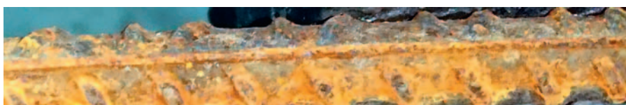
Fot. 7. Szczegół pręta bez ochrony katodowej, widoczna korozja całej powierzchni pręta