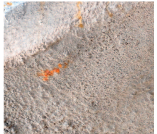
Fot. 2. Zbliżenie na torkret z inhibitorem korozji po 6 miesiącach od naprawy