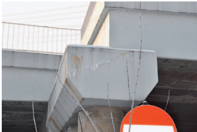
Fot. 1. Korozja odczepu podporu po kilku miesiącach od naprawy