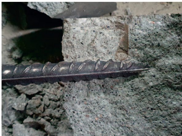
Fot. 4. Widok na chroniony pręt zbrojeniowy w miejscu podłączenia protektora