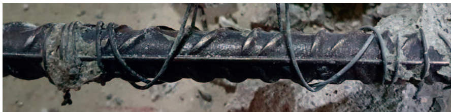
Fot. 5. Widok na chroniony pręt zbrojeniowy w odległości około 40 cm od miejsca podłączenia do protektora