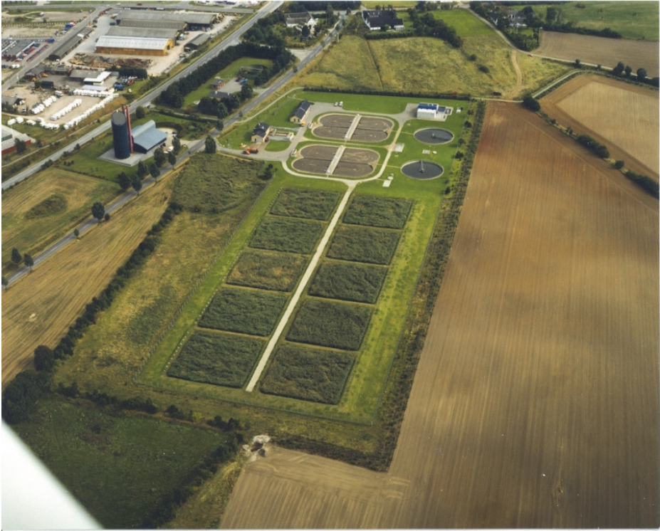
Rys. 4. Konwencjonalna oczyszczalnia ścieków z częścią osadową realizowaną w złożach trzcinowych,

System trzcinowy w Helsinge (rys. 4) odwadnia i stabilizuje nadmierny osad ściekowy pochodzący z konwencjonalnej oczyszczalni ścieków obsługującej 42 000 RLM (Równoważna Liczba Mieszkańców) i stabilizuje 630 ton suchej masy osadów w ciągu roku. System ten zajmuje powierzchnię wynoszącą 10 ha i jest złożony z 10 basenów trzcinowych. Jest eksploatowany od 1996 roku.