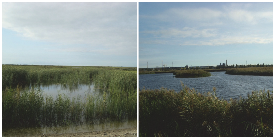
Rys. 3. System trzcinowy Fusina, foto M. Gajewska Fig. 3. Treatment wetland in Fusina, foto M. Gajewska

Tabela 1. Jakość ścieków na dopływie i odpływie w systemie hydrofitowym Fusina, (Kantawanichkul 2009)