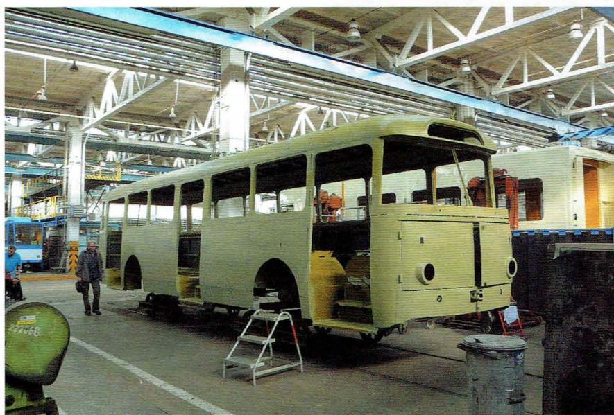
Konserwacja nowego poszycia trolejbusu. Widoczne, odtworzone, oryginalne śrubowanie na styku arkuszy blach