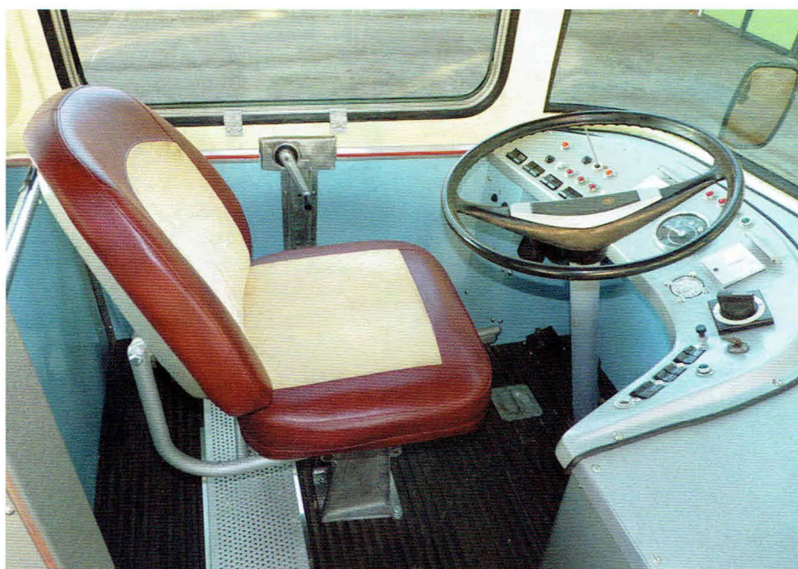
Podczas renowacji przywrócono pierwotny stan kabiny kierowcy