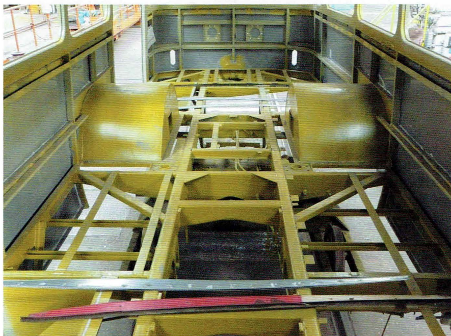
Konserwacja konstrukcji po zakończeniu prac naprawczych

Remont gdyńskiej Škody 9Tr w Ostrawie, od początku przebiegał w atmosferze entuzjazmu, ze względu na nietypowy charakter zadania. Nie bez znaczenia był fakt, że wśród załogi firmy Ekova Electric pracują entuzjaści komunikacji miejskiej, którzy nie tylko solidnie wykonają powierzone im zadanie, ale także postarają się wnie odtworzyć każdy element trolejbusu. Ekova Electric to spółka-córka DP Ostrava (Przedsiębiorstwa Komunikacyjnego w Ostrawie), wydzielona niedawno z jego