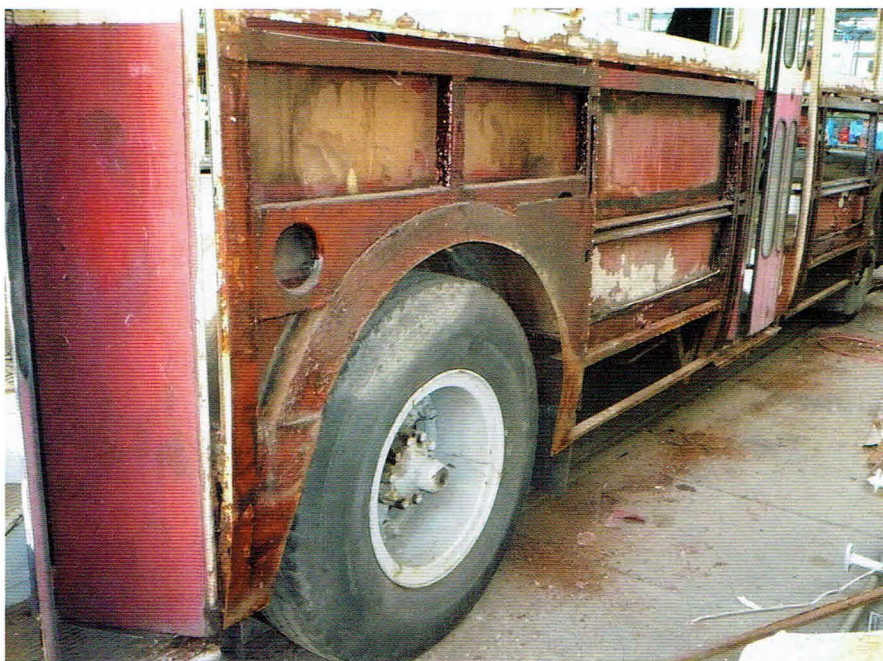
Demontaż trolejbusu w warsztatach Ekova Electric a.s. Widoczne ogniska korozji poszycia i konstrukcji

działający na wszystkie koła oraz hamulec postojowy – ręczny działający na koła tylne. Sterowanie trolejbusem odbywa się przy pomocy trzech pedałów – co jest cechą charakterystyczną dla czeskich trolejbusów. Prawy pedał to zadajnik jazdy, po środku znajduje się zadajnik hamowania elektrodynamicznego, a po lewej stronie zadajnik hamowania pneumatycznego. Rozdzielenie pedałów hamowania elektrodynamicznego i pneumatycznego miało na celu ułatwienie ruszania pod wzniesienie. Jednostką napędową pojazdu jest szeregowy silnik 3AL 2943rN o mocy godzinnej 115 kW. Układ rozrządu jest zbudowany ze styczników indywidualnych i zapewnia 11 pozycji rozruchowych. Do napędzania układów pomocniczych służy jeden szeregowy silnik zasilany napięciem 600 V. Wnętrze jest ogrzewane nagrzewnicą elektryczną o mocy 7,8 kW.