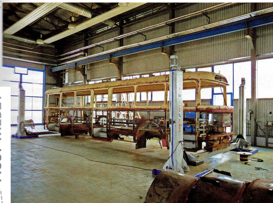
Prace nad konstrukcją po zakończeniu demontażu Škody

W specyfikacji przetargowej zamieszczono także klauzulę zakładającą możliwość poszerzenia zakresu remontu trolejbusu do maksymalnej wartości 120% wynagrodzenia zaoferowanego przy składaniu oferty, w związku z możliwością wystąpienia udokumentowanych czynników, potwierdzonych przez zamawiającego, niemożliwych do przewidzenia na etapie przygotowywania remontu. Klauzula miała umożliwić weryfikację zakresu prac po demontażu całego trolejbusu, a w szczególności