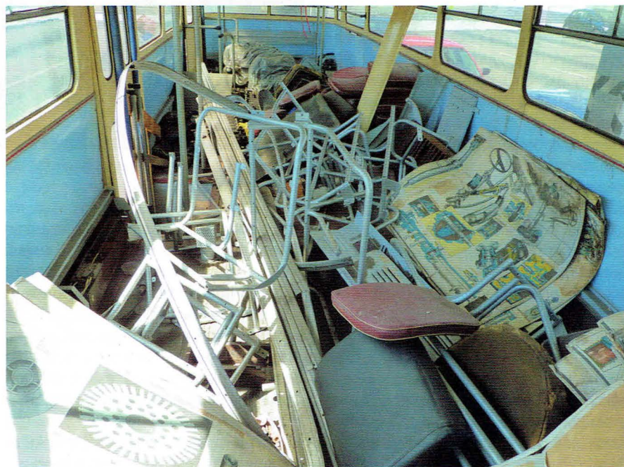
Wnętrze trolejbusu przed remontem. Widoczne, zdemontowane elementy wyposażenia wnętrza i aparatury napędowej

Egzemplarz pozyskany od LTEK to podtyp 9Tr20, lecz w Gdyni najwyższy rodzaj eksploatowanych trolejbusów Škoda to 9Tr15. Różnica pomiędzy najmłodszymi egzemplarzami z Gdyni, a zakupionym wynosiła 5 lat, więc nie wszystkie elementy były oryginalne w historycznym trolejbusie względem „dziewiątek” eksploatowanych w Gdyni, co często niesprawiedliwie powodowało krytykę postronnych osób. Najważniejszym był jednak fakt, że odkupiony od lubelskiego towarzystwa trolejbus posiadał sterowanie stycznikowe. Unikatowość tego trolejbusu podkreśla fakt, że z wyprodukowanych kilkunastu tysięcy trolejbusów typu 9Tr zachowano zaledwie kilka (nie licząc nadal eksploatowanych, zdegradowanych trolejbusów na Ukrainie i w Bułgarii). Muzealne egzemplarze zachowane są w Eberswalde (Niemcy), Kownie i Wilnie (Litwa), Bratysławie