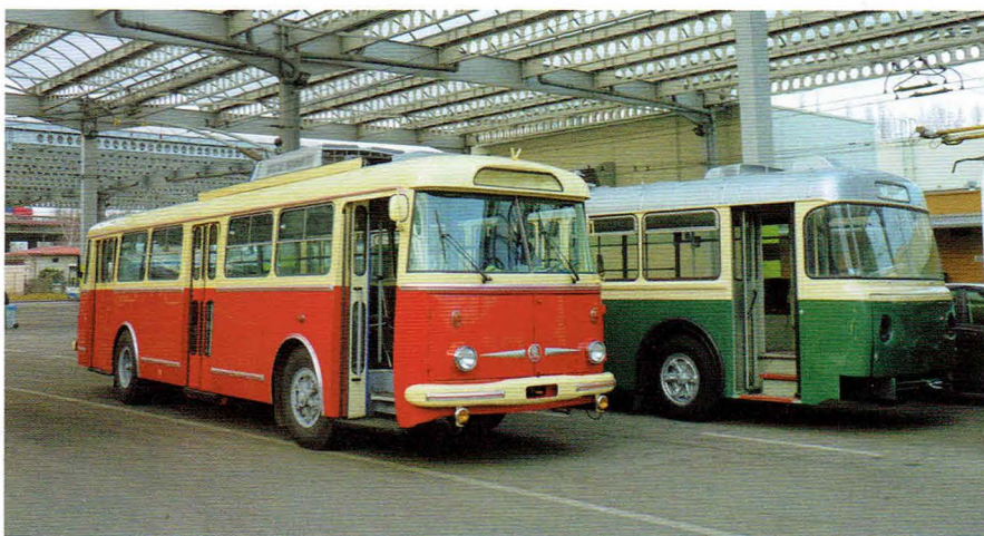
Trolejbus po zakończeniu remontu na terenie zajezdni PKT w Gdyni, grudzień 2011 r.

ukończenia zadania na 02.12.2011 r. Wówczas trolejbus przekazano przedstawicielom PKT, a transport do Gdyni, na wyspecjalizowanej lawecie niskopodwozowej został zorganizowany 12.12.2011 r.