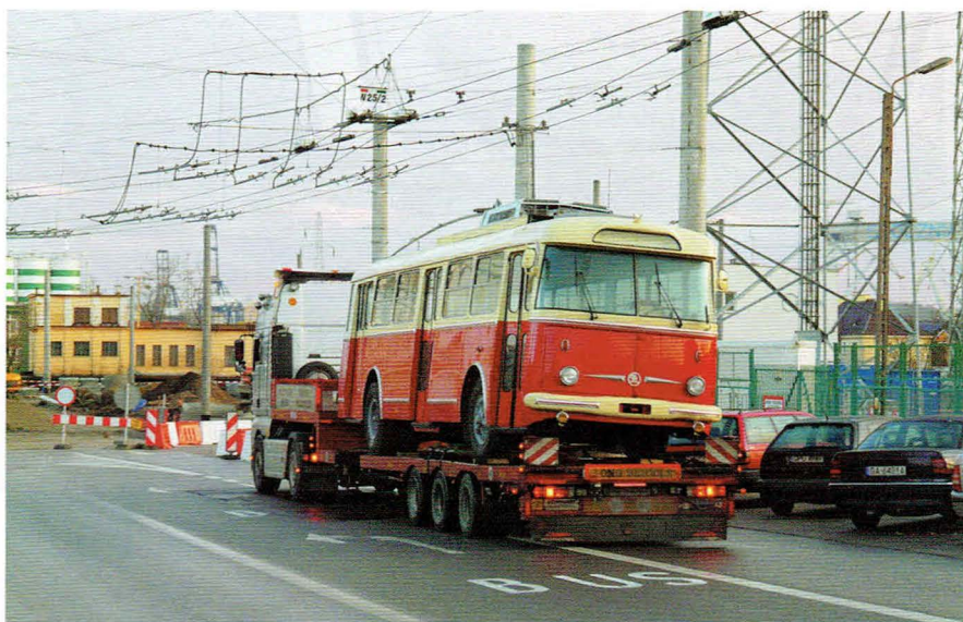
Transport Škody 9Tr do Gdyni po zakończeniu renowacji

Pierwotny termin wykonania remontu był ustalony na dzień 15.11.2011 r. jednak ze względu na obiektywne czynniki związane z szerszym zakresem prac podpisano aneks do umowy zmieniający datę