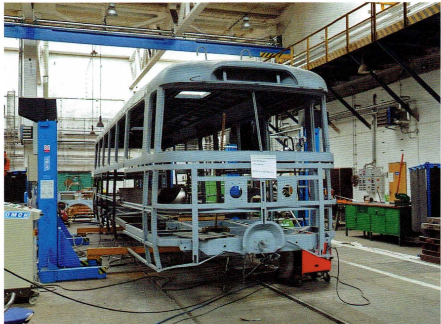
Prace nad konstrukcją trolejbusu po wypiaskowaniu. Wymiana elementów pionowych i poziomych konstrukcji nadwozia