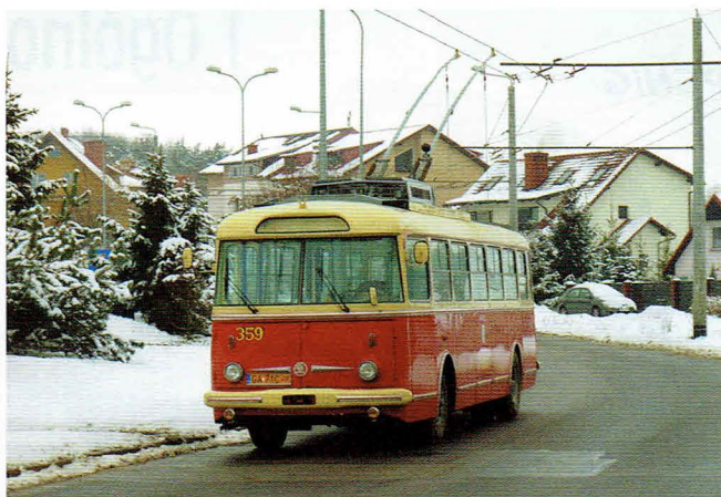
Škoda 9Tr podczas jazd testowych na gdynskich ulicach