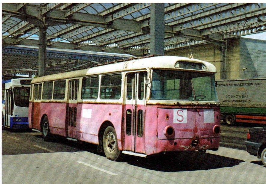
Stan trolejbusu przed podjęciem działań remontowych

Po przeprowadzeniu analizy sytuacji uzyskano informacje, że ten rodzaj taboru jest nadal eksploatowany liniowo wyłącznie w Bułgarii (w niewielkiej liczbie) oraz na Ukrainie. W jednym i drugim przypadku są to pojazdy niezbyt oryginalne, po wielu modyfikacjach, w bardzo słabej kondycji technicznej. Ponadto brak kontaktu branżowego z bułgarskimi przewoźnikami skierował uwagę pomysłodawców wyłącznie na ukraińskie miasta. Kolejną barierą, która pojawiła się w przypadku możliwości zakupu trolejbusu, były kwestie natury prawnej oraz dostępność trolejbusu na Ukrainie.