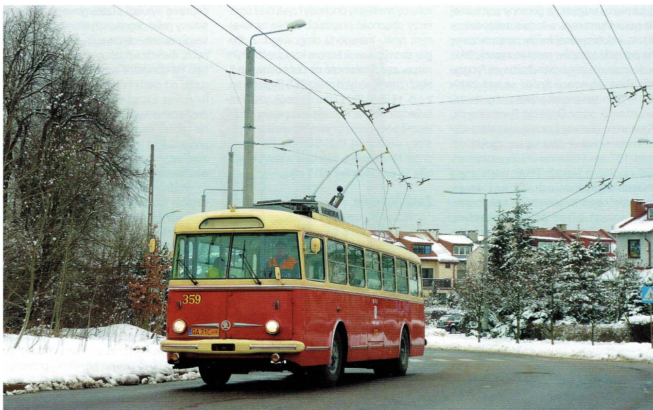
Škoda 9Tr z oznaczeniami typowymi dla 1970 r.