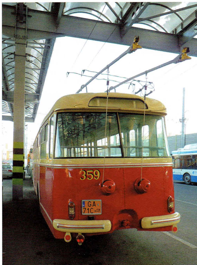
Tyłna ściana trolejbusu wraz z „zabytkową” tablicą rejestracyjną