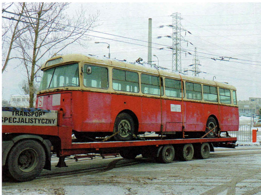
Przyjazd lawety z trolejbusem Škoda 9Tr z Lublina do zajezdni trolejbusowej w Gdyni, styczeń 2010 r.

W 2009 r. powstał plan uruchomienia specjalnej linii historycznej, na której eksploatowane byłyby zabytkowe trolejbusy. Od początku planowano sprowadzenie do Gdyni trolejbusu Škoda 9Tr, który w odróżnieniu od szwajcarskiego Saurera, był silnie związany z historią komunikacji trolejbusowej. Koncepcja sprowadzenia do Gdyni trolejbusu czeskosłowackiej produkcji była obciążona od początku problemem dostępności tego typu pojazdów. Model 9Tr zakłady Škoda Ostrov produkowały w latach 1961-1982. Do Gdyni trolejbusy tego typu dostarczane były w latach 1962-1970 i żaden z egzemplarzy nie zachował się do dzisiejszych czasów. Mimo, iż czeskosłowackie trolejbusy przez 20 lat stanowiły trzon komunikacji trolejbusowej w Polsce, to także w Lublinie nie zachowano egzemplarza muzealnego 1 . Dodatkowym problemem był fakt ewolucji modelu 9Tr w trakcie produkcji. Chcąc sprowadzić do Gdyni model związany z historią miasta, należało ograniczyć zakres poszukiwań pojazdów ze sterowaniem stycznikowym, a więc do pojazdów wyprodukowanych do 1978 r. Od 1979 r. zakłady Škoda produkowały trolejbusy wyłącznie tyrystowe, których w Gdyni nie eksploatowano. Spółzostwa zaangażowane w pomysł pozyskania Škody musiały odpowiedzieć na pytanie: skąd pozyskać tego typu trolejbus?