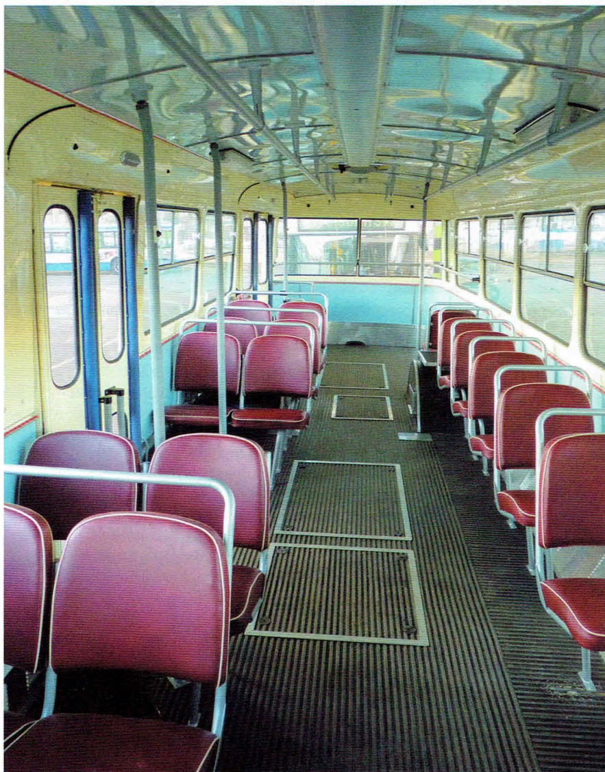
... i przedziału pasażerskiego

Škody na tzw. „żółtych” tablicach rejestracyjnych. Na podstawie skompletowanej dokumentacji Wojewódzki Konserwator Zabytków dokonał wpisu pojazdu do ewidencji pod numerem 688 na dzień 06.01.2012 r.