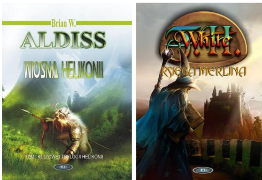
Ilustracja 1. Okładki z bohaterami fantastycznymi: Brian W. Aldiss, Wiosna Helikonii ; T.H. White, Księga Merlina [Wydawnictwo Solaris]