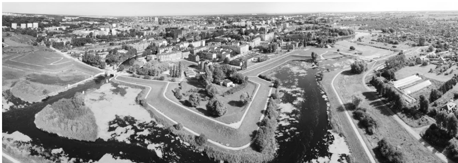
Fot. 1. Widok z lotu ptaka na Dolne Miasto w Gdańsku