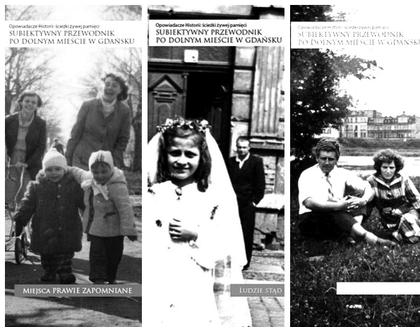
Fot. 2. Okładki trzech subiektywnych przewodników po Dolnym Mieście w Gdańsku wydanych w ramach projektu „Ścieżki żywej pamięci”