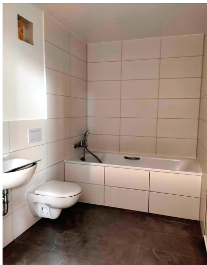
Fot. 3. Wykończona prefabrykowana łazienka GOLDBECK Comfort

Analiza kosztów wykazuje, że w budownictwie mieszkaniowym najbardziej czasochłonnym i kosztownym etapem jest wykończenie węzłów sanitarnych. W związku z tym firma GOLDBECK Comfort na początku 2020 r. wprowadziła do sprzedaży łazienki prefabrykowane z pełnym wykończeniem wnętrza (fotografia 3).