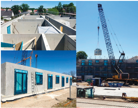
Fot. 1. Budowa budynków mieszkalnych z prefabrykatów modułowych w Berlinie

Odpowiadając na te zmiany i potrzeby rynku europejskiego, wiele zakładów prefabrykacji betonowej opracowuje nowe rozwiązania systemowe do budownictwa mieszkaniowego, które pozwolą na przyspieszenie realizacji inwestycji (fotografia 1). Ogromną za-