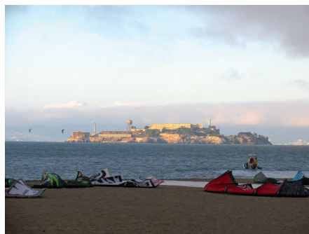
Fot. 8. Przyciągają tu nie tylko piękne widoki na Golden Gate, słynne więzienie Alcatraz i zatoka San Francisco, ale też możliwość obserwacji imprez i zawodów sportowych związanych z wodą

Do tej pory park odwiedziło ponad 10 mln osób. Rocznie korzysta z niego 1 mln ludzi, dziennie ponad 2,5 tys. Crispy Field stało się niezwykle popularnym miejscem odpoczynku, rekreacji i sportu. Dzięki projektowi nastąpiło połączenie dotychczas odizolowanego miasta z wodą. Co roku realizowane są