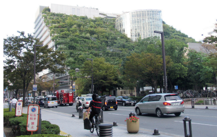
Fot. 14. Fukuoka. ACROS. Zielona architektura z tarasowymi zielonymi ogrodami organicznie wtapia się w otoczenie budynku