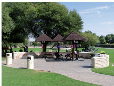
Fot. 11. Creek Side Park, Dubaj. Zacienione miejsca są w tym klimacie niezbędne