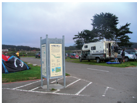
Fot. 7. System informacji turystycznej i ekologicznej, wpleciony w układ promenad, parkingów i miejsc biwakowych, towarzyszy wszystkim aktywnościom w bardzo popularnym parku