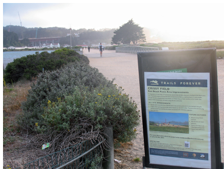
Fot. 5. Crispy Field, San Francisco. Ścieżki piesze są wyposażone w rozmaite tablice informacyjne

sca, ale też o zagrożeniach związanych z globalnym ociepleniem, powodzią, erozją brzegu morskiego, zarówno dla samego parku, jak i w kontekście ogólniejszym, dla świata. Można przeczytać, jak żyć w bardziej zrównoważony sposób, aby zapobiegać zagrożeniom, i jak włączać się do akcji proekologicznych.