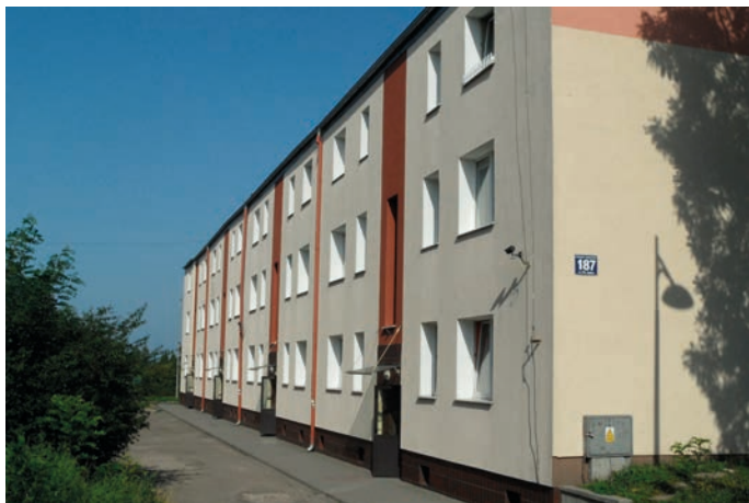
Rys. 2. Budynek mieszkalny na osiedlu „Paged” w 2018 roku

Tempo prac budowlanych na osiedlu „Paged” było imponujące, ponieważ do lutego 1936 roku ukończono 5 bloków mieszkalnych z 176 lokalami. W kolejnym sezonie budowlanym wykonano dalsze dwa bloki (B3 i B4), a następnie inwestycję przerwano z nieustalonych powodów. Dodać należy, że ponad osiemdziesięcioletnie budynki na osiedlu „Paged” (podwyższone o jedno piętro) nadal pełnią swą funkcję mieszkaniową (rys. 2).