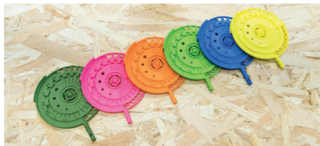
Rys. 2. Wielobarwne elementy wykonane w technologii SLS (ich porowatość sprawia, iż doskonale nadają się do barwienia w gorących kąpielach)

Wyniki prowadzonych badań wskazują, iż typowa część wydrukowana w technologii SLS jest w około 30% porowata. Występująca porowatość nadaje elementom charakterystyczny, ziarnisty wygląd powierzchni. Oznacza to, iż mogą one dodatkowo absorbować wodę, dzięki czemu możliwe jest ich barwienie w gorących kąpielach na wiele różnych kolorów – rysunek 2. W przypadku stosowania drukowanych modeli w środowisku wilgotnym, konieczne jest przeprowadzenie dodatkowej obróbki postprocesingowej.